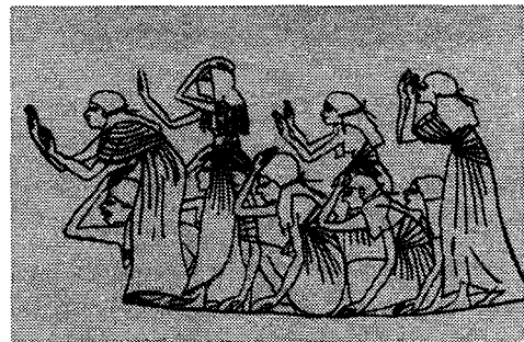
(Fig. 2) 애도하는 여인들 (무용의 역사 I, 양선희, p.142)

자식을 얻기 위한 목적으로 의식에서 추던 복부 무용은 이집트의 무용에서 출산과는 무관한 동작들이 되어 단순한 여흥 무용으로 구경거리적인 요소를 띄게 되었다. 반주자의 손뼉에 박자를 맞추어 팔을 모으고 엉덩이를 흔드는 동작은 복부 무용의 한 형태이다. 10)