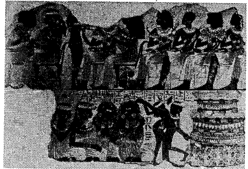
(Fig. 3) 무용수와 구경꾼들 (A History of Costume in the West, Francois Bourcher, p.96)

을 보면(Fig. 3) 팔을 머리 위에서 엮듯이 움직여 "마임"(mime : 말없이 무용하는 것을 뜻함)으로 상당 부분이 연기되었고, 이것이 고도로 발달되어 오늘날의 무용극으로 발전되었다. 17) 또한 이들 춤의 특징은 대담하게 브릿지(bridge)하거나(Fig. 4) 거꾸로 서는 등 곡예적인 자세를 취했는데, 이러한 춤은 중요한 종교적 효과를 가진 것으로 보여진다. 특히 장엄한 의식 무용도 곡예적인 동작을 필요로 하는 것 같다. 뒤로 재주넘는 움직임은 자연의 윤리적 믿음을 상징하고 있다. 18) 이처럼 외국인 무용수는 이집트 제왕이 외국의 영토를 확장시켜 권력을 잡게 되면서 많은 노예들이 생김에서 기인한 것으로 집권자들은 노예 중에서 무용을 잘하는 사람을 선출하여 즐겼던 것으로 생각된다.