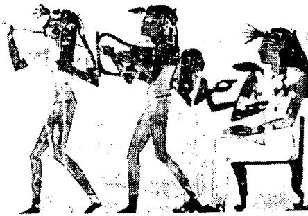
(Fig. 13) 연주하는 무용수들 (costume of fashion, James Laver, p.35)

에 착용된 칼라시리스는 직조법이 발달하여 얇고 고운 린넨으로 만들어 드레이프가 많이 생기며 반투명한 직물 자체의 미를 표현하였으며 (Fig. 11) 무용 의상에서 칼라시리스는 여흥 무용보다는 장례 의식과 관련된 종교 무용 (Fig. 10)에서 주로 착용되고 있었다. 18왕조 시대의 벽화 (Fig. 13) 54) 에서 보면 칼라시리스나 튜닉에 사용된 린넨의 반투명함이 잘 묘사되어 있다. 악기를 연주하면서 무용하는 무용수들은 얇은 린넨을 사용한 것으로 보이는 튜닉속에 뉴의를 입은 모습이 잘 표현되어 오늘날의 시드루(see-through) 패션의 일면을 보여 주고 있다.