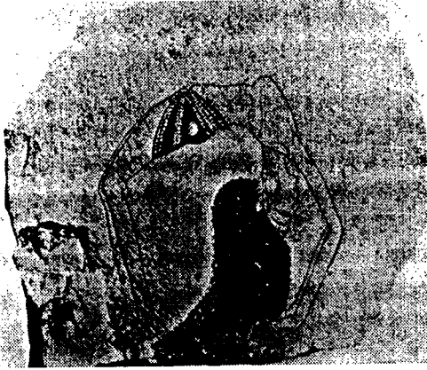
(Fig. 4) 브릿지라 불리우는 곡예 (The History of Dance, Mary Clarke & Clement Crisp, p.26)

이집트의 무용은 종교와 결부되어 죽은 자의 행복을 빌고 또 부활을 염원하는 마음에서 추었던 종교 무용이 대부분이었으므로 그 사회에서 중요하게 취급되지 않았으나 수세기를 걸쳐 매우 서서히 변화하였으며 많은 사람들이 무용을 즐겨 세 가지 형태의 무용 즉, 상징적인 형식을 갖는 종교 무용과 인간의 본능을 표현하는 여흥 무용, 남을 즐겁게 해주기 위한 무대 무용 등을 발전시켰다. 특히 이집트의 여흥 무용은 대단히 번성하여 서양 문화의 기원인 그리스나 이스라엘에 전파되었다. 20)