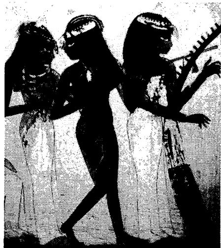
(Fig. 12) 주악의 여인들 (대세계 미술전집 1, p.35)