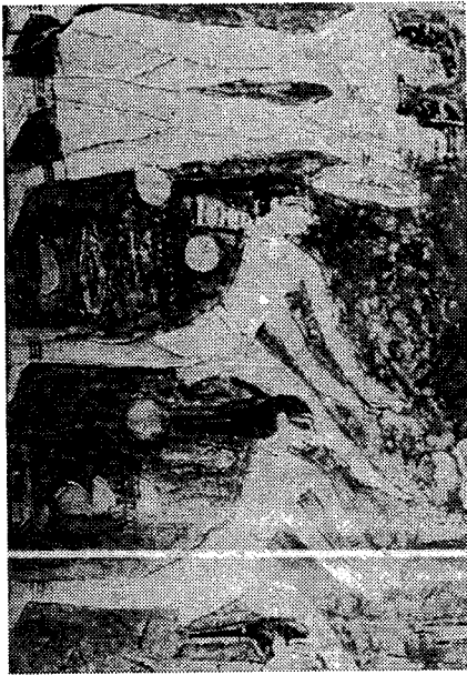
(Fig. 14) 고왕조 무용수들 (The History of Dance, Mary Clarke & Clement Crisp, p.24)

기름에 섞어 만든 반죽을 머리 꼭대기에 붙여 두어 그것이 녹아 얼굴로 흘러내릴 때 향기로운 냄새를 내도록 했으며, 얼굴을 타고 몸으로 흘러들어 옷을 더욱 밀착시키게 하는 효과도 가져오는 콘(cone)을 머리에 얹고 다녔는데, 여흥 무용을 하는 무용수들이 사용하고 있다.(Fig. 11)(Fig. 12)(Fig. 13) 이러한 콘은 종교 무용과 동작이 큰 곡예무용을 하는 무용수들은 착용하지 않은 듯하다(Fig.4) (Fig. 14).