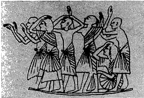
(Fig. 9) 애도의 제스처 (무용의 역사 I, 양선희, p.143)

양식은 신왕국 18왕조 아켄아텐왕에 의해 본격적인 개혁이 이루어졌다. 그는 관습에 얽매이지 않는 유능한 왕으로서 종교적 개혁뿐 만 아니라 미술 양식에 있어서도 새로운 기풍을 시도하여 아마르나(Amara) 미술을 창시하고 이집트의 문예 부흥을 일으켰다. 이 문예 부흥의 기운은 복식에서의 고조와 일치하여 18왕조 복식에서는 이집트 복식의 정수를 볼 수 있다. 43)