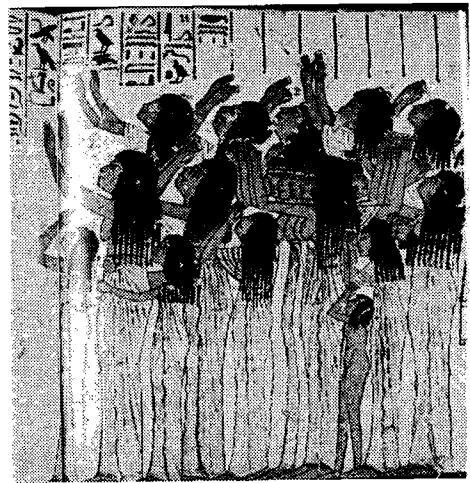
(Fig. 10) 장례식의 춤 (무용의 역사, 배소심, p.83)

이집트의 종교 무용은 장례 절차의 일부로써 사용되었다. <Fig. 10>에서처럼 장례식에서 유족의 슬픔을 돋우기 위해서 직업적인 "곡하는 여자"가 고용되었다. 이 여성들은 땅에 끌릴 듯이 긴 트레이퍼리의 어깨 끈이 없는 킬트나 칼라시리즈를 착용하고 있으며 그들의 실루엣은 마치 슬픔이 줄줄 흘러내리는 듯 표현되고 있다. 이집트에서는 여성 무용수를 엘마(Alma)라 칭했는데 그들의 춤은 세속적이면서도 신성하였고 무척 기교적이며 개성적이었다고 한다. 46)