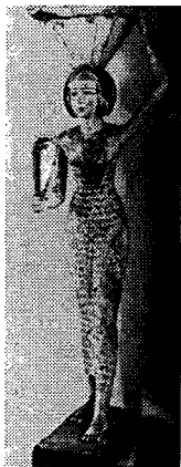
(Fig. 5) 무늬있는 쉬스 스커트

중왕국시대에 이르러 쉬스 스커트의 형태는 고왕국시대와 차이가 없으나 문양이 나타나며 (Fig. 5) 장식적으로 표현되고 있다.