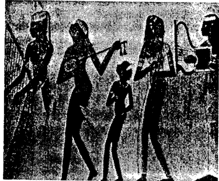
(Fig. 11) 무용수와 악사들 (Survey of Historic Costume, Phyllis Tortora, Keith Eubank, p.30)

노예들에게 춤을 추게 한 것 같다. 47) 이집트의 여흥 무용 발전을 보여주는 <Fig. 11>의 '무용수와 악사들'이라고 불리는 그림은 이집트 여흥 무용이 어떠한 형식을 갖고 있는 무용인가를 또한 여흥 무용의 의상을 알려주는데 필요한 자료이다. 무용수들은 노예와 같이 나체로 묘사되고 있거나 또는 겨우 생식기만을 가릴 수 있는 작은 천을 좁은 허리띠에 부착한 모습으로 표현되고 있다. 48) 小林信次 49) 는 이 시대의 무용수는 벽화에서는 거의 나체로 보이지만 실은 토네즈와 같은 아주 얇은 의상을 착용하였다고 상상되며 제 18왕조 테베-나크트(Nakht)의 분묘 '주악의 여인들'(B.C 1425년경) 50) 이라고 불리는 <Fig. 12>의 나체로 보이는 악기를 들고 있는 여성을 잘 살펴보면 얇은 타이즈를 착용하고 있다고 하고 있으나, 대다수 직업 무용수들은 나체에 가까운 가는 끈으로 된 紐衣만을 걸치고 있다.(Fig. 3) 紐衣만을 착용하고 있는 여악사는 반주하며 한편으로는 춤을 추는 무용수였으리라 생각된다. 紐衣만을 걸친 무용수의 복장은 칼라시리스나 튜닉을 입은 악사들의 의상과는 여러 벽화에서 확연히 구별되고 있다. 이 紐衣는 여흥이나 곡예 무용을 위한 직업 무용수의 의상으로 정착되어 무용 의상이라는 한 범주를 마련했다고 볼 수 있다. 이집트에서는 왕 뿐 아니라 전제 정치하에 이루어지는 여러 단계의 신분 계급은 상징적인 복식으로 표식되었다. 51) 무용하는 사람이나 악사들 및 상류 부인들은 칼라시리스를 옆을 터놓은 채로 입어 52) 폭이 넓은 것을 강조하였다.