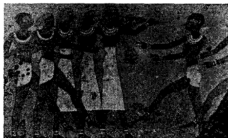
(Fig. 8) 춤추는 소녀 (서양 무용사, 정승희, p.32)

상을 보면 중앙의 세명의 소녀들은 어깨 끈이 없는 종아리 길이의 쉬스 스커트를 착용하여 엠파이어 라인을 보여 주고 있는데 비해 나머지 소녀들은 앞은 트이고 뒷부분만 가려 험라인이 자연스런 곡선을 이루며 앞 허리에서 모아지는 피트 라인의 극히 짧은 로인 클로스를 입고 있다. 곡선의 험라인은 고 왕국시대의 직선적인 험라인의 로인 클로스 에 비해 보다 심미적으로 발전된 형태임을 알 수 있다. 이와 같은 형태의 로인 클로스는 왕족이나 神의 복장에서는 갈라 스커트로서 대부분 또 다른 로인 클로스와 겹쳐 입거나 앞부분을 가리기 위해 쉐도트를 착용하고 있다. 로인 클로스를 입은 무용수들은 쉬스 스커트를 입은 소녀들에 비해 발의 움직임을 크게 하고 있다. 또한 종교적인 축제에서는 여자들의 나체가 마귀를 놀라게 하여 쫓아낸다는 믿음 때문에 옷의 앞을 텃다 41) 고 한다. 이러한 무용 의상의 형태는 <Fig. 4>에서도 볼 수 있다.