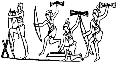
(Fig. 1) 무기의 무용 - 활춤 (무용의 역사 I, 양선희, p.140)

종교 및 주술적 성격의 원시 무용은 무기의 무용, 풍작을 기원하는 무용, 腹部 무용, 장례 의식 무용과 같은 네 가지 형태로 재현되어 나타난다 6) .