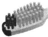
Figure 1. 편평한 형태의 칫솔두부