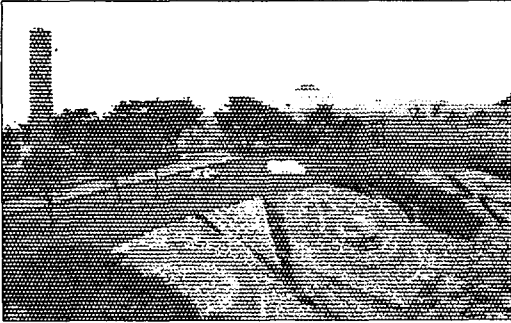
국립 현대 미술관 전경(사진)

우리는 자연의 아름다움과 사람에 의해 만들어진 조형물이 조화를 이룰 때, 그 환경의 쾌적함을 느낄 수 있다.