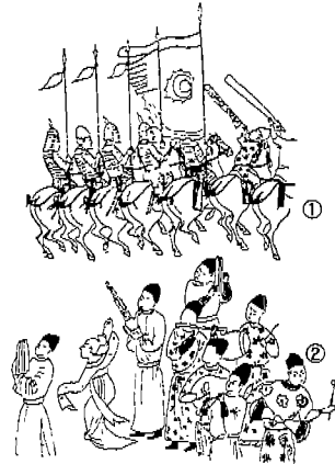
<도 3> 1. 둔황 막고굴 156굴 벽화, 장의조 출행도중 남자 무용인, 주석보, 223. 2. 둔황 막고굴 156굴 송국부인 출행도 벽화.