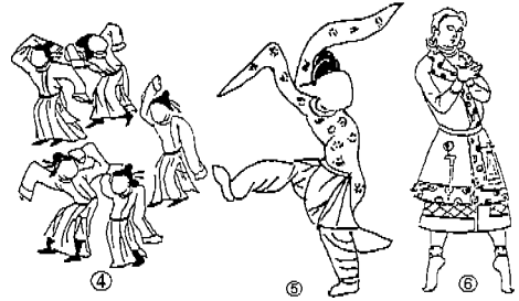
<도 7> 1. 유림 38굴 벽화, 무악인. 2. 섬서성 서안 신사육묘 출토 벽화. 3. 돈황 막고굴 360굴 무악인 벽화. 4. 5. 서역의 미술 3. 6. 신강 구자벽화 무용인