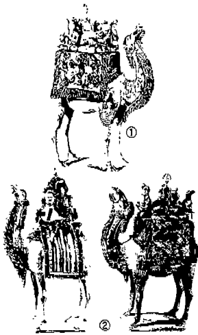
<도 1> 1.2. 세계미술전집, 중국편 도판