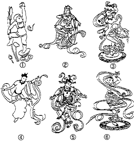
<도 6> 1. 막고굴 320굴 벽화, 무용인. 2. 막고굴 12굴 벽화, 무용인. 3. 막고굴 197굴 벽화, 무용인. 4. 막고굴 201굴 벽화, 무용인. 5. 유림굴 25굴 벽화, 무용인. 6. 막고굴 341굴 벽화, 무용인.