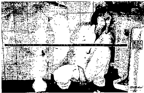
<그림 8> '잠뱅이' 의류광고<7>