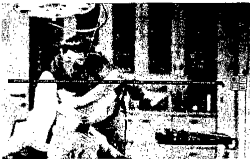
<그림 9> '잠뱅이' 의류광고<7>