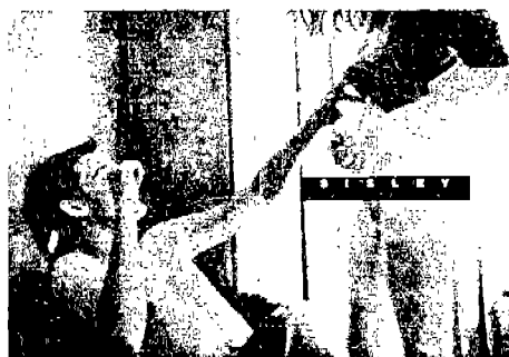
<그림 2> '시슬라' 의류광고<2>