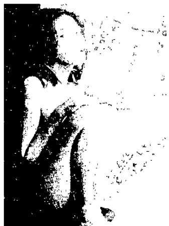
<그림 4> 'YAH'의 케쥬얼 의류광고<4>