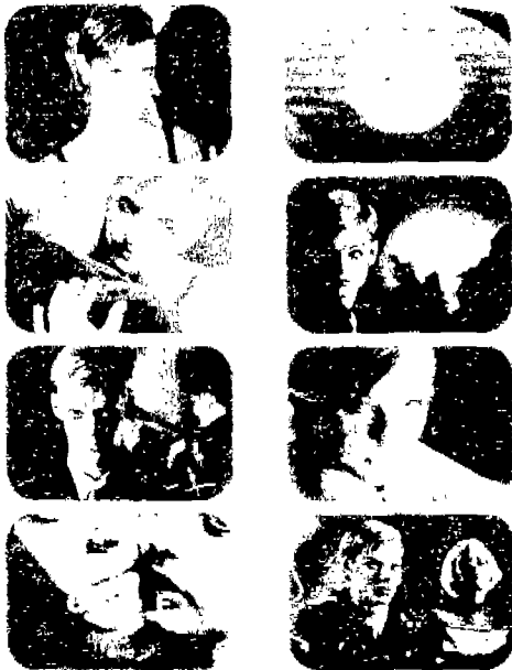
<그림 5> 나산의 'uneF' 남녀캐주얼 의류광고<5>

현대에는 성에 따른 고정관념이 깨어지고 있으며 양성성을 지닌 인간형을 이상적으로 추구하고 있음을 알 수 있다. 현대 사회에서의 세계화, 국제화에 따른 추세는 다원주의에 적합한 인간형을 추구하게 하였고 다원주의적 인간형은 세계 추세에 발맞추어 나갈 수 있는 인간으로써의 다양한 능력을 요구한다. 13) (그림 5)(그림 6)