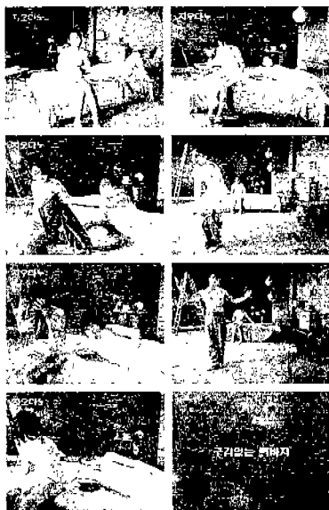
<그림 1> '지오다노' 의류광고<1>

직접적인 성행위를 연상시키는 상징적 표현은 의복의 착용상태 또는 행위로서 나타나며 보는 이의 심층 심리 면에 성적 호소를 하는 간접적 표현은 물체나 현상들의 상징적 표현 10) 으로 나타난다.(그림 1)(그림 2)