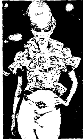
<그림 2> Collezioni, N.55, '97 S/S

<그림 3>은 '98 S/S Jean Paul Gaultier의 작품으로 극단적으로 모던하고 미니멀한 블랙 원피스 위에 로코코시대를 재현한 의상을 혼합하여 과거와 현재를 잇고 있다.