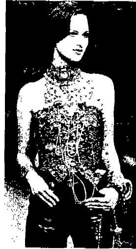
<그림 13> Gap, '95 S/S, p.68

에스닉한 로맨틱시즘의 특징 가운데 또 하나는 상징적이고 신비로운 원시적인 모티브를 도입한 경향에서도 보여진다. <그림 14>는 '96-'97 A/W에 발