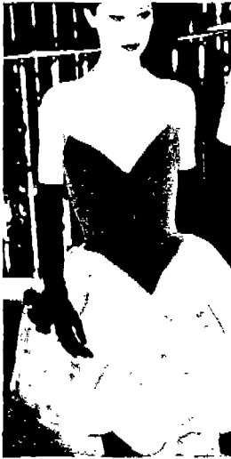
<그림 9> Fashion Show, '95-'96 A/W

조하고 있으며, 이는 미니멀리스트의 엄격함과 로 맨티시즘의 부드러움 사이의 결합이라 할 수 있다. <그림 10>은 '97 S/S에 발표된 가는 끈 장식의 Dolce & Gabbana의 작품으로 크로셰로 만든 슬립 드레스의 심플한 라인과 꽃문양을 통해 미니멀한 감각의 로맨티시즘을 표현하고 있다.