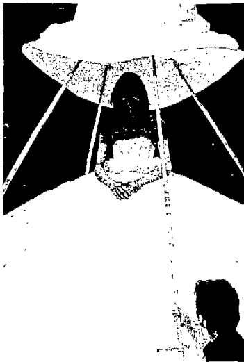
<그림 7> Vogue, 1998. 7, p.82.