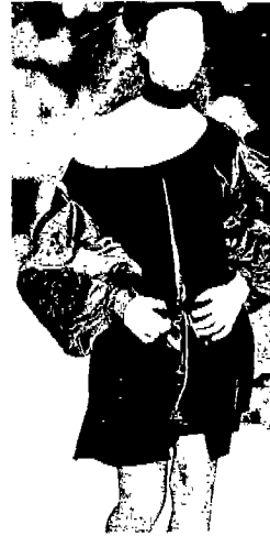
<그림 8> Fashion Show, '94 S/S

1960, 70년대를 풍미했던 미니멀리즘(Minimalism)은 90년대 이후 양식상의 극단성을 가진 로맨틱시즘과 새로이 융합하여 절제를 통한 단순함이 갖는 아름다움을 보여주고 있다. 포스트 모더니즘의 현상으로서 미니멀리즘은 80년대 패션에 도입되어 극한까지 생략한 심플한 스타일을 선보인 바 있으며, 90년대 이후 로맨틱한 분위기와 접목되어 새로운 스타일로 등장하고 있다. Christian Dior의 작품인 <그림 8>은 심플한 블랙 벨벳 원피스에 18세기 로맨틱풍 소매를 그대로 차용하므로써 미니멀 로맨틱시즘을 보여주고 있다. 이는 사물을 그대로 예술 작품에 도입하는 미니멀아트와 예술적 행위와 연관시켜 볼 수 있다. 한편 '95-'96 F/W에 Nina Ricci는 로맨틱의 장식적 경향을 배제하고 코르셋의 형태와 부풀린 스커트로 로맨틱풍의 X자형 실루엣만을 강조하므로써 미니멀 로맨틱시즘 경향을 나타내고 있다.<그림 9>