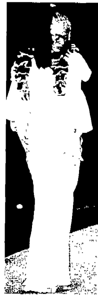
<그림 14> Fashion News, '96-'97 A/W

표된 John Galliano의 작품으로 신비적이고 마술적인 원시부족의 머리장식과 메이크업 스타일이 파스텔톤의 로맨틱한 의상과 혼합되어 현실 세계와 분리된 새로운 세계를 지향하고 있는 것처럼 보인다.