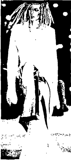
<그림 15> Collezioni, N.55, '97 S/S

한 작품인 <그림 15> 역시 John Galiano의 '97 S/S 작품으로 레이스를 주된 소재로 하고, 그 위에 덧입은 랩 스커트는 new ethnic romantic을 표현하고 있으며, 이러한 경향은 오늘날 융합(fusion) 또는 혼성물(hybrid)과 동의어인 크로스 오버(cross over) 패션이 로맨틱시즘과도 맞물려 있음을 알 수 있다.