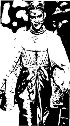
<그림 12> Collezioni, N.37, '94 S/S

는 로맨틱시즘의 에스닉 성향은 낭만주의 예술미학에서 처음으로 시사한 추의 개념과 연관된다. 35) 그리고 이국적인 로맨틱시즘의 경향은 주로 동양적인 색채와 문양 그리고 액세서리로 주로 나타나고 있다. 전위적인 디자이너 Jean Paul Gautier는 마오 칼라의 중국풍 재킷과 인도풍의 액세서리, 랩 스커트 그리고 코르셋을 무질서하게 결합하여 기존 질서체계에 대한 위반과 남용을 로맨틱하게 표현하고 있으며, 최근의 에스닉 표현 경향은 다국적의 혼용된 멀티 에스닉이라 할 수 있다.<그림 12>