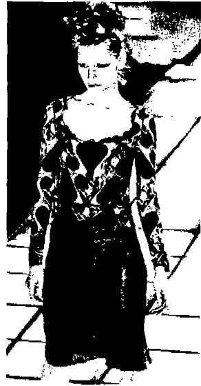
<그림 11> Colletion, '97 S/S

화려한 꽃무늬로 대표되는 디자이너 Gianni Versace도 로맨티시즘의 과도한 장식적 경향을 과 감히 배제하고, 단순화되고 절제된 프릴장식과 심 플한 라인을 통해 미니멀 로맨틱 경향을 보여주고 있다.<그림 11>