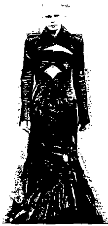
<그림 6> Collezioni, N.53, '96 A/W

<그림 6>은 Red or Dead 의 작품으로 퇴폐적 이미지의 로맨틱 핑크를 통해 아방가르드를 표현하고 있는데, 짧은 가죽 재킷과 슬림하고 여성적인 원피스의 상반된 결합을 통해 충격적인 이미지를 연출하고 있다. 한편 상식을 뛰어 넘는 Yoji Yamamoto 의 '98 S/S 작품은 긴 막대로 떠받칠 만큼 지나치게 커다란 모자와 크리놀린 스타일을 재현하여 패션쇼에서의 충격과 흥미를 더해 주고 있다.<그림 7>