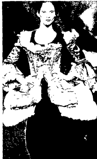
<그림 3> Collezioni, N.63, '98 S/S

이처럼 레트로 로맨티시즘에 나타난 중세적인 모티브의 도입과 속옷의 겹옷화 현상, 과도한 장식적 모티브 등은 레트로로맨티시즘을 표현하는 기법으