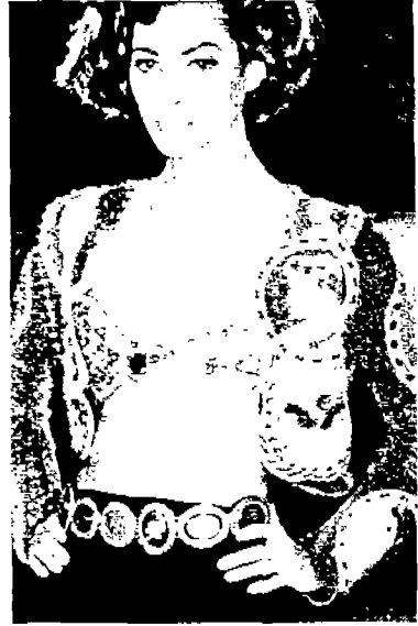
<그림 1> Collezioni, N.22, 91-92 A/W

표현된 로맨틱시즘 경향은 패러디 기법을 통해 표면화되기도 한다. 패러디 기법은 기성의 이미지를 모방하여 새롭게 재창조하는 것으로 어떤 양식의 기계적인 적용에 기인하는 것이 아니라, 오히려 현시대의 사회와 문화를 중세와 르네상스 문화·사회와의 상관 관계에서 파악하고자 하는 것이다. 28)