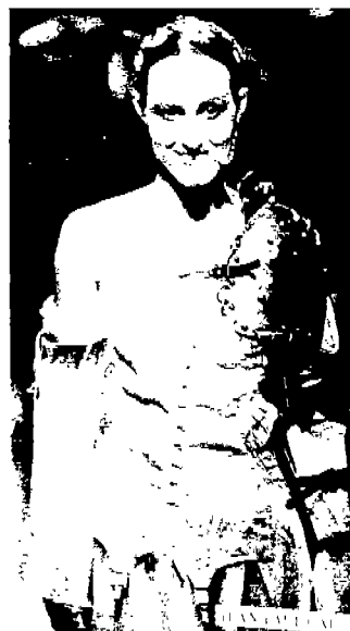
<그림 5> Collezioni, N.37, '94 S/S

한편 코르셋 모티브를 중세 갑옷 이미지로 전환하여 파괴적인 이미지를 연출한 Thierry Mugler의 작품<그림 5> 역시 기존 형식을 무시한 아방가르드의 형태로 표현하고 있다. 로맨틱 무드는 속옷의 겉옷화, 디테일의 위치 전환, 그리고 전혀 엉뚱한 소재를 복식의 한 부분으로 전위시켜 사용하는 변용과 전위에 의한 데페이즈망(depaysment) 33) 기법을 통해 기존 복식의 전통에 도전하는 추(醜)의 미를 인정하기 시작했던 낭만주의 예술의 미학논리와도 연결됨을 알 수 있다.