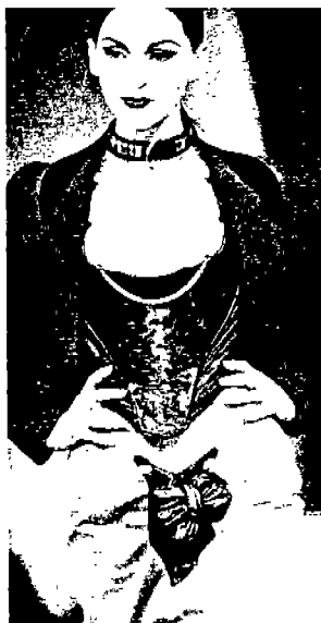
<그림 4> Collezioni, N.22, '91-'92 A/W

<그림 4>는 충격적인 양식의 파괴와 혼합으로 즐거움을 주며, 과거로부터 영감을 새롭게 창조하는 디자이너 Vivienne Westwood의 작품으로 르네상스 시대 남성복에 사용된 cod piece를 여성복에 이색적으로 혼합하고, 가슴이 보일 정도로 decollete된 가죽 코르셋을 모던한 재킷과 실험적으로 조화시키