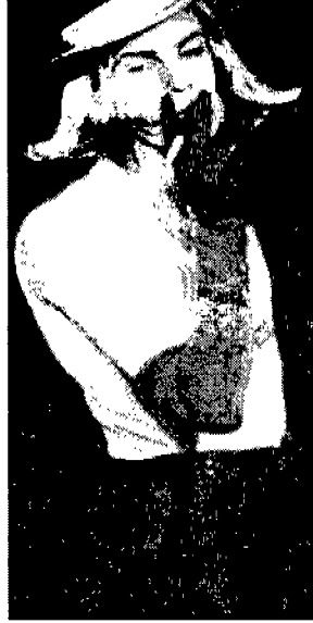
〈그림 15〉 Dolce & Gabbana 〈'95-'96 Uomo Collezione〉