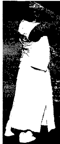
〈그림 3〉 이신우 옴드 〈Fashion Today 94년 3월〉