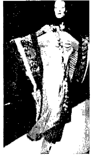
〈그림 13〉 Jean-Paul Gaultier 〈'96 Collection〉

레이퍼리나 튜닝형의 평면형의 비구조적인 형태로 서 실루엣, 재질, 무늬등에서도 두드러진 여성적 혹은 남성적 특질을 배제한 중립적인 이미지 61) 를 나타내어 남성, 여성의 이미지가 아닌 인간자체의 통합적인 의미를 갖고 있다.