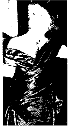
〈그림 10〉 Jean-Paul Gaultier 〈'96-'97 Uomo Collezioni〉

이 느껴지고 유연하고 부드러운 분위기를 만들어 내어 여성적 이미지의 대표적인 무늬이다. 58) 이러한 여성성을 표현하여 여성복에서 볼 수 있었던 꽃무늬(그림7)는 양성적 이미지가 느껴지는 남성복에서 많이 사용하고 있다.