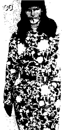
〈그림 7〉 Scapa 〈'95-'96 Uomo Collezione〉

게 하는 남성적인 이미지이며, 얇은 질감은 하늘거리는 가벼움으로 흔들림을 표현하고 여러겹 겹쳐서 생기는 아름다움을 나타내는 여성적 이미지이다. 56) 즉 남성복에서의 얇은 재질의 셔츠는 하늘거리면서 양성적 이미지를 주고 이에 비해 두꺼운 느낌의 트위드, 홈스펀, 크레이프 직물은 여성복에 사용되어 양성적 이미지를 준다.