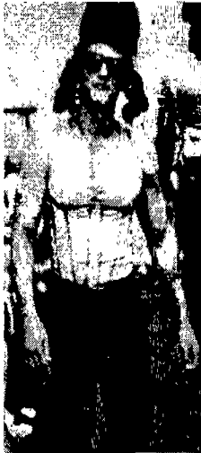
〈그림 1〉 Jean-Paul Gaultier 〈'95 Uomo Collezioni〉