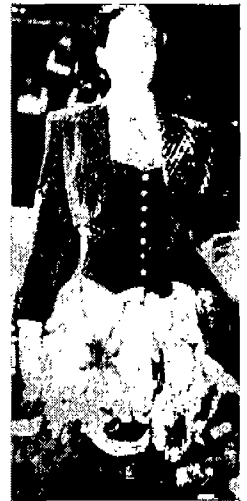
〈그림 4〉 Sportmax 〈'88-'89 Collection〉

제에 남성적 이미지와 여성적 이미지를 공유해 남성과 여성의 이미지를 모두 느낄 수 있는 경우와 이성의 복식요소를 전체에 도입한 경우에도 착용자의 성을 완벽하게 위장하는 것이 불가능하게 되어 착용자의 성이 남게 되어 자신의 신체적 성과 복식을 통해 상대방 성을 공유함으로써 양성적 이미지를 소유하게 되는 경우 둘 다를 포함하는 것이다.