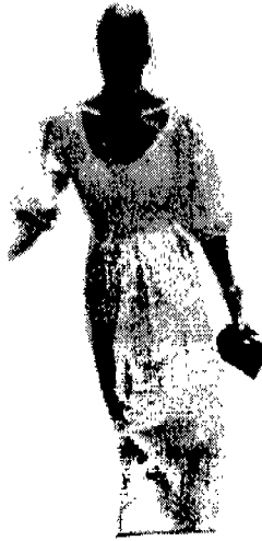
〈그림 9〉 〈You & I〉