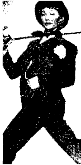
〈그림 12〉 〈Vogue Italia 93년 9월〉