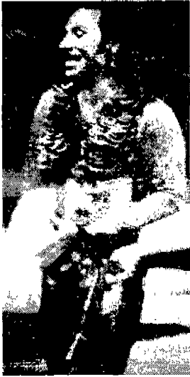
〈그림 11〉 Jean-Paul Gaultier 〈'92 Collection〉