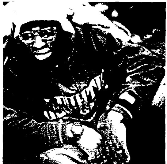
<사진 7> 후드 티셔츠 캥골, 선글라스, 스포츠 시계 (The Source, 1998, 10. #109)

미국에서 덩치가 큰 미국 흑인들이 편하게 입고 춤도 추고 운동도 하는 빅사이즈의 티셔츠이다. 후드 티셔츠<사진 7> 역시 큰 사이즈로 힙합팬츠와 함께 힙합룩으로 입혀지는데, 후드 티셔츠 앞면에 여러 대학교의 학교 로고가 새겨져 있어 짧은 캠퍼스의 분위기를 느끼게 한다. 이런 패션은 90년대 들어 유학 붐이 일면서 유학을 다녀 온 유학생들에 의해 더욱 유행되어 우리나라에서도 각 대학교 이름이 새