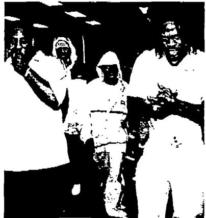
<사진 2> 후드 트레이닝복과 팬티 밑에 입은 팬츠(The Source 1998. 10. #109)