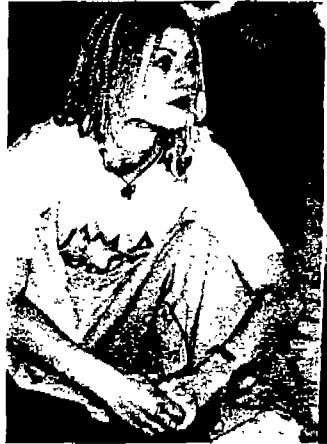
<사진 5> 빅 사이즈셔츠와 와이드 팬츠(Sport & Street, COLLEZONI, N.9, 1998)