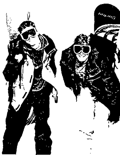
<사진 9> 스노우보드 룩과 보드 슈즈 (Sport & Street, COLLEZONI, N.6, 1997)

겨진 티셔츠가 나타났다. 또한 이런 후드티 셔츠는 스포츠 룩에서의 스포티한 느낌도 준다. 스트리트 패션의 한 경향인 미스매치 경향으로 <사진 8>과 같이 XL와는 대조적인 타이트하고 작은 미니티셔츠가 힙합패션으로 유행하고 있는데, 이런 티셔츠를 일명 미니(Mini)티셔츠, 베이비(Baby)티셔츠라고 부른다. 트레이닝 팬츠와 어울리는 집업 티셔츠는 스포티한 힙합패션에 맞추어 티셔츠에 지퍼를 단 스타일로 이 지퍼는 티셔츠 뿐만 아니라 카디건에도 많이 사용되어 힙합스타일을 연출하고 있다.