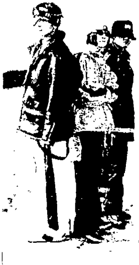
<사진10> 힙합그룹 서태지와 아이들의 스노우보드 룩 (Fashion Today 1996. 5)