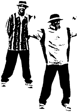
<사진 4> 트레이닝셔츠와 배기팬츠 (Sport & Street, COLLEZONI, N.5, 1997)