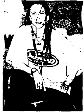
<사진 6> 빅 사이즈셔츠와 트레이닝 팬츠(Sport & Street, COLLEZONI, N.9, 1998)

배기팬츠<사진 4>는 죄수복에서 유래했으며, 정통 오리지널격 힙합 스타일이다. 와이드 팬츠<사진 5>는 헐렁하고 넉넉한 사이즈의 면바지로 힙합패션에서도 유용한 아이템으로 최근 브랜드들마다 가장 잘 팔리는 아이템이다. 10대들을 끌고 지나간 힙합 패션이 새롭게 재해석되면서 보다 넓게 보다 다양하게 나타나는 와이드 팬츠는 면바지로 입증된 아메리칸풍의 스포츠캐주얼 트렌드와 맞물려 그 인기를 더하고 있다. 트레이닝 팬츠<사진 6>는 흔히 땀복이라고 부르는 나일론 소재의 트레이닝 팬츠로 스포츠 룩이 유행하면서 힙합 매니아들에게도 새롭게 인기를 끌고 있다. 또한 전체적으로 헐렁하고 병병한 힙합 청바지는 힙합 스타일의 기본이 된다. 그리고 큼직한 사이즈의 오버롤은 한쪽 어깨를 풀어서 입으면 더욱 힙합스러워 힙합 스타일로써도 인기가 있다.