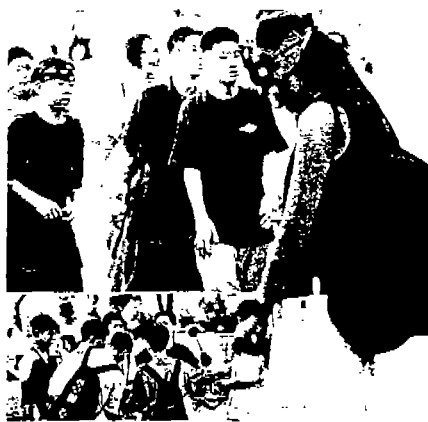
<사진11> 헐렁한 셔츠와 바지, 백팩 (섬유저널, 1997. 9)