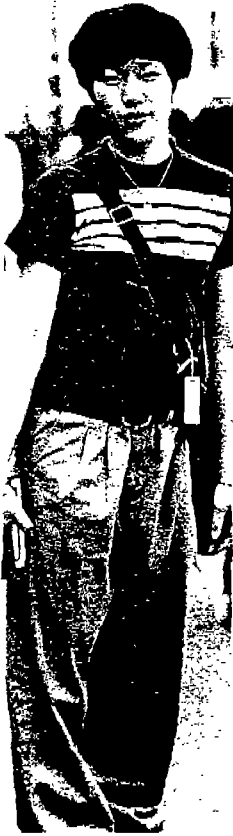
<사진 8> 미니셔츠 (Ecole 1998. 5)