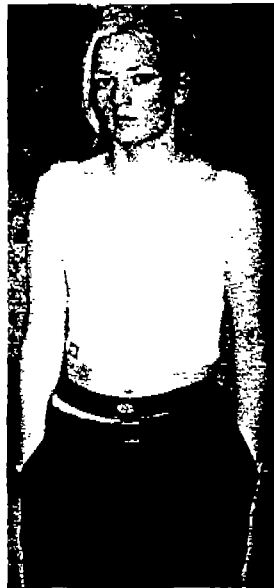
<사진 1> 팬티 밑에 걸쳐 입은 힙합바지(Sport & Street, COLLEZONI, N.9, 1998)

힙합이란 우리가 생각하는 것처럼 천하고 불량한 것이 아니며 오히려 이것은 세련된 것이고 파격적인 것으로 작위적이지 않다. 누군가 필요에 의해서 조작된 것도 아니고 있는 그대로 길거리에서 생성된 문화로써 기존의 틀을 엮어버린 가장 자연스럽게 인간적인 문화인 것이다.