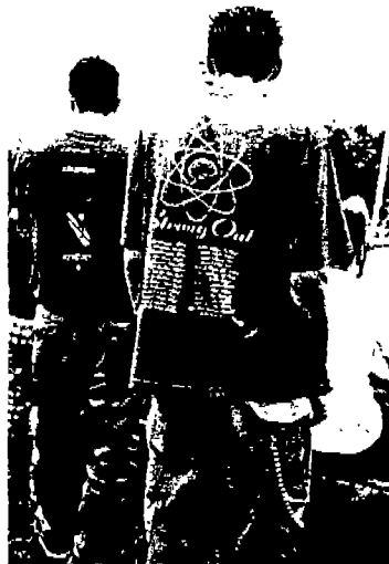
〈사진 3〉 박스셔츠와 카고팬츠 (Sport & Street, COLLEZONI, N.9, 1998)

카고팬츠〈사진 3〉는 흔히 전방바지, 또는 군복바지로 통하는 밀리터리 스타일의 바지로 험령하게 해서 입으면 힙합으로 연출하기에 좋다. 전체적으로 통이 넓어 허벅지가 볼록하다가 밑단으로 내려올수록 좁아지는 스타일의 바지인