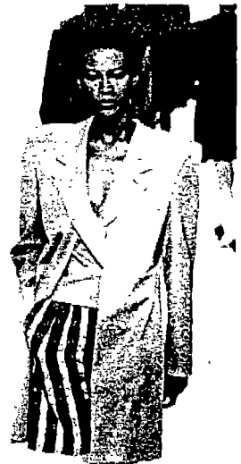
(사진 4) G. Armani, 「Couture - The Great Designers」, P.410. - 여성복에 남성적 힘을 부여한 Mannish Look.