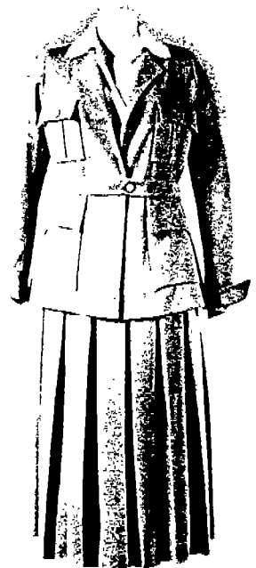
(사진 1) G. Chanel 「CHANEL- THE Couturiere at work」, P.14. - 남성적 Gender 이미지가 강화된 여성 Suit.

당시 유니섹스 룩을 보다 전위적이고 진보적인 시각에서 제안하였던 Rudi Gernreich은 나이든 여성에서 10대 소녀들에게 이르기 까지 적용될 수 있을 만큼 논리적이고 순수한 창작성을 지니고 있었다. 그의 복식사적 업적은 20세기 초 Chanel이 그러했듯이 20세기 후반 반세기 동안 패션의 철학