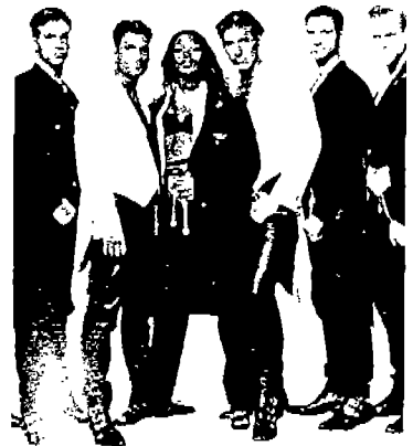
(사진 5) G. Versace, 「Versace - Signature」, P.13. - 남녀모두 관능성을 강조한 복합적 Sexuality 이미지의 Suit.

이프 진 셔츠를 입으며, 가죽과 금속장식을 부과시킴으로써 성도착적 유형(Fetish-type)을 표현하였다. 이것은 산업화된 사회에서 요구되었던 남성의 가혹한 의무를 탈피하고,