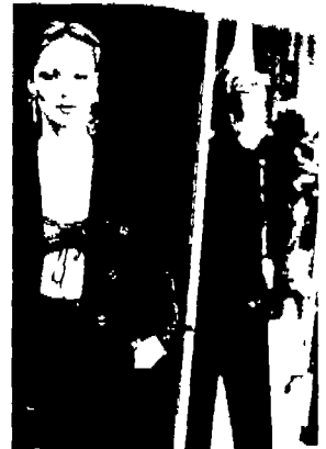
(사진 3) Y.S Laurent, 「Exotismes」, P.123. - 남성적 Gender 이미지와 여성의 관능성이 공존하는 Tailored Suit.

지닌 단순화된 역동적 추상성이라는 근대적 외관을 지녔다. 23) 그러므로 남성 수트를 기초로 하여 고안된 여성의 수트는 지성미를 추구하고 자립심이 강한 전문직종 여성들에 의해 애용되었다. 여성모드에서 주요 흐름이 된 수트는 남성 수트의 변형이었기 때문에 성숙되고 자아존중을 표현하는 형태를 취하므로써 여성수트의 관능미는 아주 신중한 이미지를 표출하는 것이다. 이제 더 이상 남성의 수트는 남성들만의 전유물이 아니며, 남성수트의 기본형태와 직물에 근거하여 만들어진 여성수트에도 근대 이후 남성이 수행해왔던 사회적 성적 특성이 여전히 남아 있는 것이다. 바지가 여성들이 착용할 수 있는 복종의 하나로 자리하였고, 여성들은 스커트를 제외한 주변의 모든 의복의 종류들을 변화시켜 자신들의 외모에 아주 큰 뉴앙스를 주면서 조화시켜 나아갔다. 그러나 어느 시대든지 사회적 통념을 거스른 패션은 여성에게 대담한 관능성을 부여한다. Y. S. Laurent의 테일러드 수트 또한 남성의 역할을 대변해 주는 의상을 여성에게 적용시킴으로써 그속에 감추어진 여성적 특성을 부각시켜 색다른 관능성을 유발하였다. 즉, 여성의 신체적 성(sex)과 남성의 사회적 역할에 따른 성(gender)의 이미지를 공존시킨 모순된 결과였다(사진 3). 1970년대 이후 그는 테일러드 스타일을 보다 화려한 여성적인 터치로 응용하여 남성적 이미지와