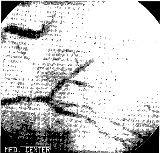
Fig. 2. Preoperative coronary angiogram showed the mid-posterior descending artery stenosis.

로 인조 혈관을 통과시켜 서혜부 절개를 통해 대퇴동맥과 문합하였다. 좌측은 장골동맥의 원위부를 절개, 죽종(atheroma)을 제거하고 인조 혈관을 문합하였다.