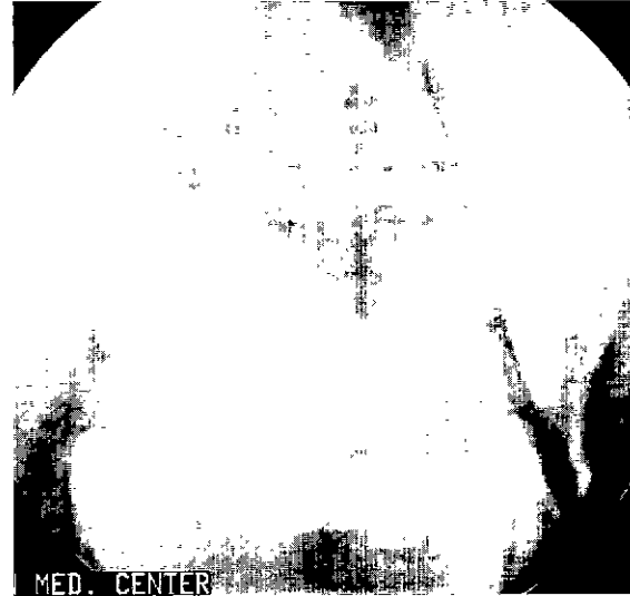
Fig. 5. Postoperative aortogram showed a good patency of the vascular graft without stenosis.