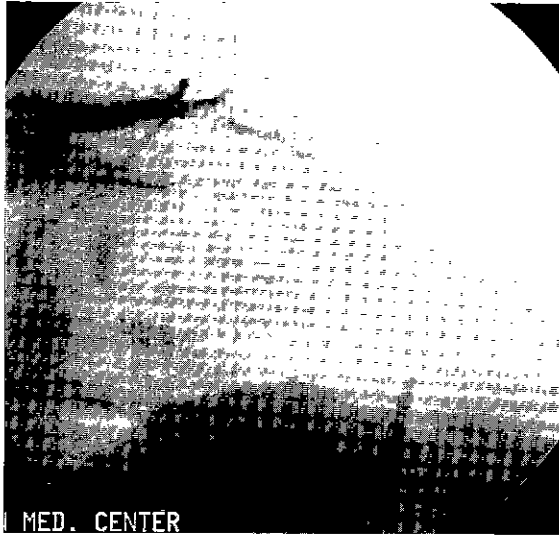
Fig. 1. Preoperative coronary angiogram showed a stenosis of the distal left anterior descending artery.