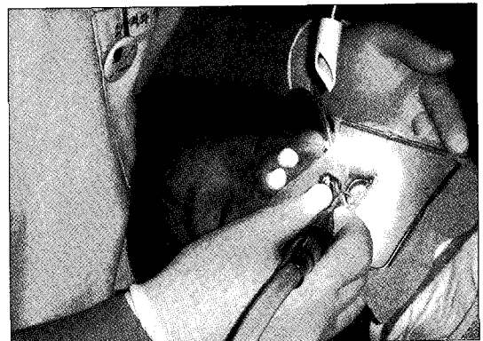
Fig. 3. 흡입도관을 Rubber Dam 하부에 위치하고 진료 의자의 다른 흡인기로 잉여가스를 제거하는 모습