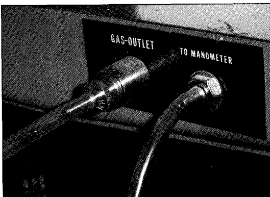
Fig. 2. 마취기와 연결 모습