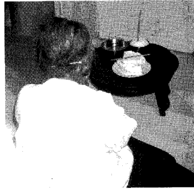
〈사진 4〉 삼신 모시기

용왕신을 모신 용단지는 수신(水神)이자 농신(農神)으로 풍우수한(風雨水旱)을 지배하는 용신을 섬기는 것으로 농사의 풍작, 풍요, 다산, 재물 등을 관장한다고 믿는다. 농경사회에서 용은 뱀과 함께 물을 상징하는 것으로 수호자로서의 의미가 강조되어 왕과 용을 동일시하여 궁중용어에 임금과 관련된 용어로 많이 사용된다(龍床, 龍顏 등). 용단지는 대체로 곡물이 취급되는 부엌 또는 고방에 봉안해 두며 때로는 안방 위 다락에 봉안하는 경우도 있다. 단지 안에는 쌀을 넣어두며 그 쌀은 주로 음력 10월 추수기 때 갈아 넣는다. 용단지에 봉안했던 쌀은 절대로 집밖에 내가지 않는데 이는 신령물이기 때문에 재물이 나가는 것이라 생각했기 때문이다 31) . 단지에 신체(神體)를 모시는 경우는 성주나 조왕, 터주 등 다른 가신신앙에도 많이 나타나는데 용단지는 용을