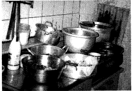
〈사진 2〉 부엌에 모신 군웅(조왕신: 울진)

떡 종류에서 뿐 아니라 성주신을 모시는 일부 가정에서는 그 해 농사 지은 햅쌀을 생쌀로 올리는 경우인데 이는 농촌지역의 가을 수확기가 끝난 뒤 친신(薦新)의 의미로 같은 시기에 매년 주기적으로 반복되는 농촌지역의 성주신 모시기라고 생각된다. 이 주기적 반복성은 풍요와 건강 획득으로 자아존재의 지속을 위한 동일 근원성에 따라 순환적 제의행동으로 형상화되었다 29) .