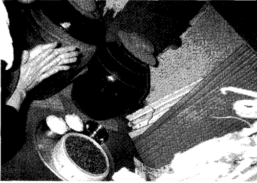
〈사진 5〉 용단지 모시기

제에 용왕신앙을 볼 수 있다. 이렇듯 가신 신앙을 섬기는 유형은 내륙지방과 비슷하지만 해안지방 주민들의 자연 재해에 대한 두려움이 어업이 더 추가되기 때문에 내륙지방보다 훨씬 강하게 생활에 밀착되어 있었던 것으로 생각된다. 그 예로 “미역고사”는 할머니가 정월 보름날 아침에 해안에서 줍쌀을 뿌리며 서숙(조)같이 चु츰이 성장하길 기원하는 뜻이다. 또 짬(미역밭)주가 미역밭 위에서 조밥을 뿌리며 미역의 풍년을 빈다 34) .