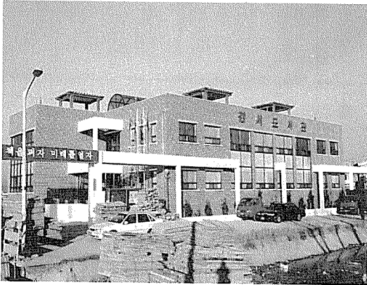
부산광역시 강서 도서관

개관일 : 1998년 1월 8일 주 소 : 부산광역시 강서구 대저2동 2011-2 전 화 : 051-973-5274