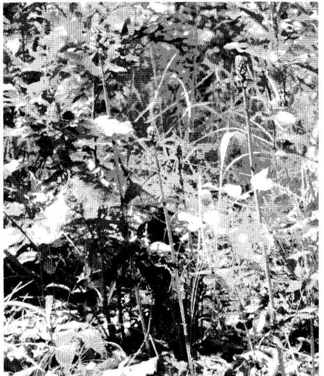
▲참나무그루터기 옆에 난 자연산 천마꽃대(관련기사 5면)

국내 생산기반 조성 차원 에서 운영중인 수급조절품 목은 95년 수급조절제도 도 입시 94품종에서 96년 29품 종으로, 다시 97년 26품종 으로 축소됐으며 98년 23~24품종으로 단계적 축 소될 예정이다. 그러나 관 련전문가들은 “이미 개방된 국산한약재의 경우 종자조 차 구하기 어려운 실정”이 라며 일단 개방된후 생산기 반이 붕괴된 품종들은 재복 구가 쉽지 않다는 점에서 우려를 표하고 있다. 또 제 조업체에서만 제조할 수 있