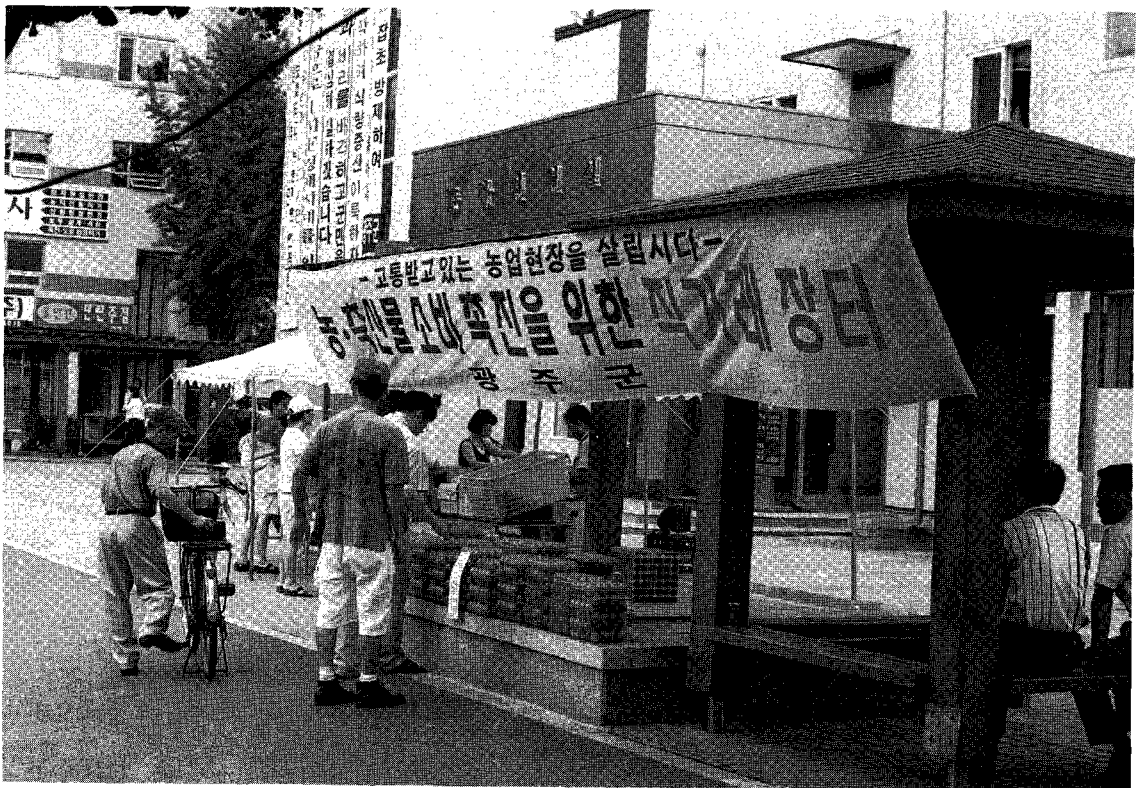
△ 경기도 광주군청의 직원과 생산자들이 계란소비 확대를 위해 마련한 광주군청앞 농축산물 직거래 장터

원들이 자발적으로 농축산물 직거래 장터를 개설해 농축산인들의 시름을 덜어주고 있어 화제가 되고 있다.