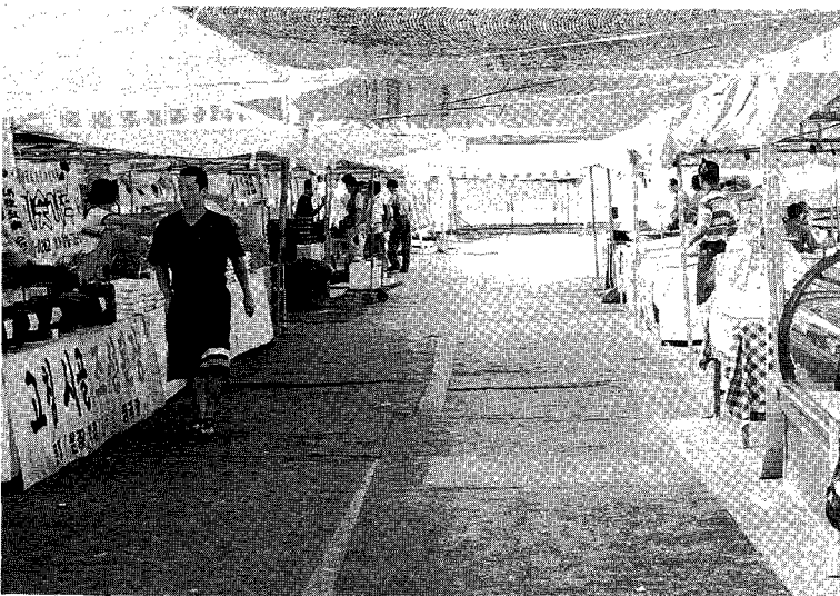
△ 서울대 대운동장에 마련된 직거래 장터는 고객 유체에 어려움이 많았던 것으로 보였다.

행사기간 7일중 3일동안 비가 내리서 학술행사는 진행에 차질이 없었지만 전시장은 지방에서 생산자 단체관람객을 제외하고는 관람객이 예상보다 많지 않았고, 더구나 경제상황이 최저조기였기 때문에