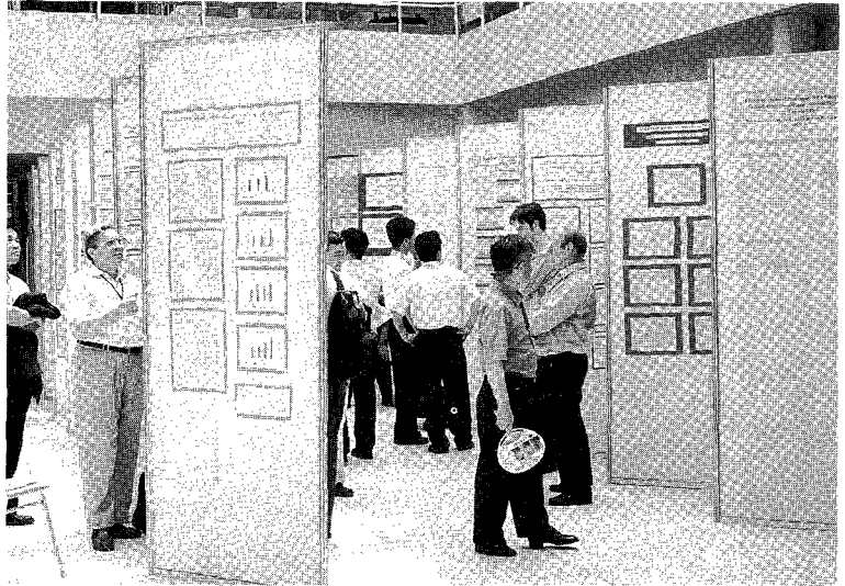
△ 대회 개최기간 중 포스터(poster) 발표는 쉽게 연구논문 결과를 알수 있을 뿐만 아니라 발표자와 토론이 가능하여 좋은 반응을 얻었다.

점에서 그 의미가 깊다고 하겠지만 국내·국외에서 전시에 참여한 업체가 67개(92부스)로 당초 예상한 500~600부스를 유치한다는 목표에 크게 미달되었고, 전시된 품목은 총 183개로 축소되었다.