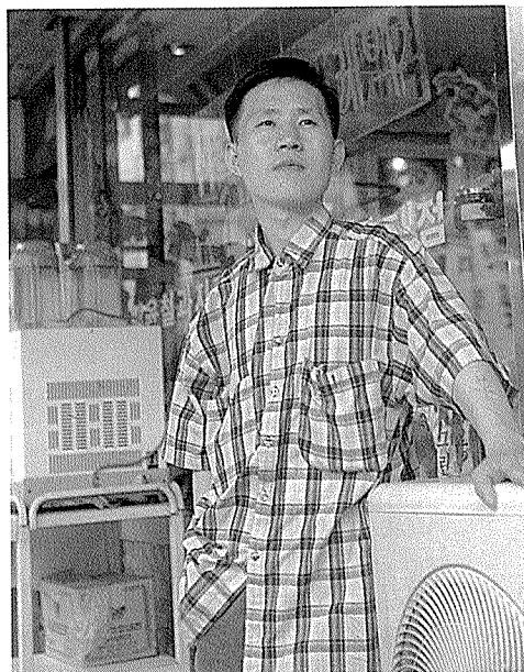
↑ 영원한 제과기술인으로 남고 싶은 게 그의 바람이다. 언젠가 세계 무대에 한국 기술인의 우수성을 알릴 수 있는 그날까지...