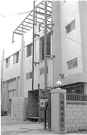
호성식품 생산공장. 연건평 345평 규모

OEM과 자체유통을 7대 3의 비율로 하고 있는 호성식품(대표 유운자)은 91년 12월에 설립됐다. 93년 8월부터 대지 650평,