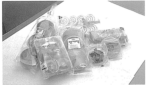
호성식품의 각종 생산 제품. OEM과 자체 유통을 병행하여 공급한다.