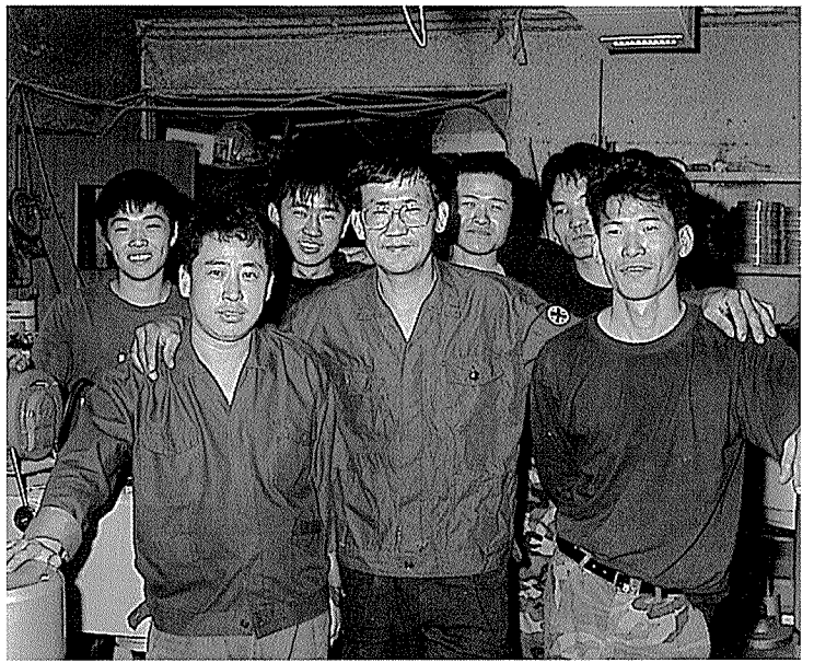
직원들과의 팀워크도 빼놓을 수 없기 때문에 신의와 화목을 무엇보다 중요시 한다.

연삭기, 성형기 등 정밀 기술을 요하는 공작기계 제조 부문에서 팀장을 맡기도 했었다. 그야말로 전문 엔지니어 출신인 셈이다.