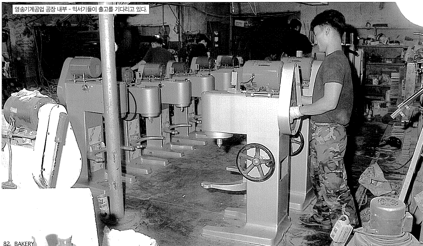
영송기계공업 공장 내부 - 믹서기들이 출고를 기다리고 있다.