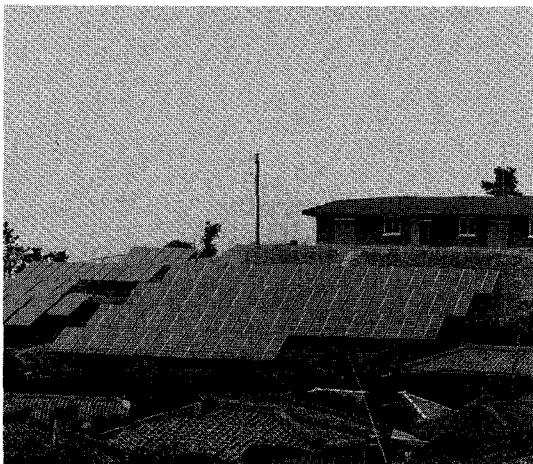
전남 하화도 60kW급 태양광 발전설비 전경

따라서, 아무리 훌륭한 에너지기술개발정책을 수립한다 하더라도 이를 잘 실천해 나가기 위해서는 정부의 노력만으로는 어려우며 에너지절약을 해야한다는 국민적 공감대 형성을 통하여 산업공정, 건물등에 개발된 에너지기술을 채택하여 사용하려는 의지가 중요하다 하겠다. ☞