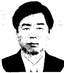
글/김 현 호