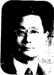
글/강 원 구 한전 중앙교육원 책임교수