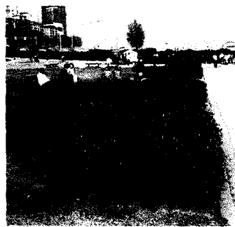
▲명자꽃나무 생을타리식 조경

에 저장하였다 5월상순에 끄집어내서 10~15cm 정도 길이로 절단하여 밑부분을 비스듬하게 다듬어 안내봉으로 삽수가 2/3정도 들어갈 구멍을 뚫고 삽수를 밀어넣은 다음 비음도(庇陰度) 50%정도 되는 해가림을 설치하고 삽목상이 마르지 않도록 물관리를 철저히 하여야 하며 활착율을 높이기 위해서는 비닐하우스 같은 시설내서 삽목하는 것이 좋다.