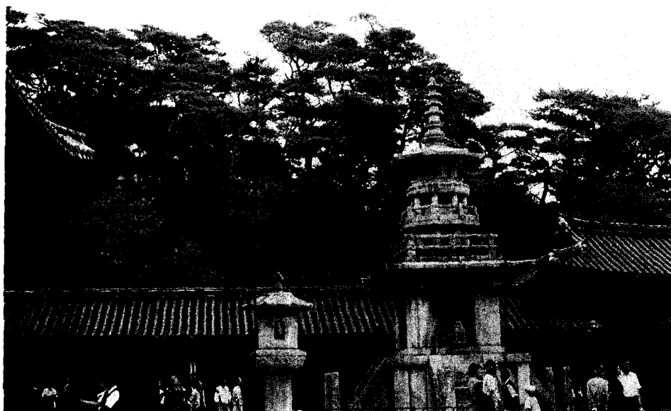
◀ 불국사 다보탑과 회랑 뒷편의 소나무 숲

뜻이 있다. 도산서원 유물관이 제 기능을 하려면 주차장 한쪽 넓은 터에 지어놓고 퇴계의 생애와 사상을 담은 기록을 먼저 보여주고 그 다음에 여유롭게 서당과 서원, 원림을 보여주어야 제대로 답사를 할 수 있다.’