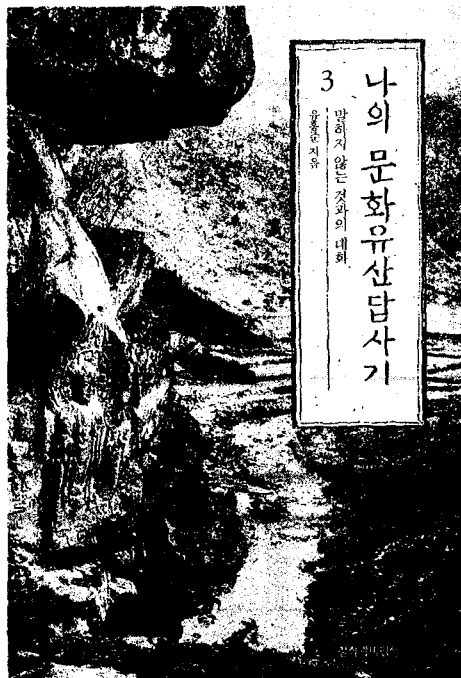
▶ 유홍준의 '나의 문화유산 답사기(3)'의 표지사진

나무는 개나리, 진달래, 산수유, 은행나무, 단풍나무, 매화, 벚꽃, 동백나무, 칠죽, 밤나무, 참나무, 포플러 등으로 대부분 꽃이 아름답고 화려하거나 흔히 볼 수 있는 것들인데 아마도 말하지 않는 문화재의 어둡고 무뚝뚝한 면을 보