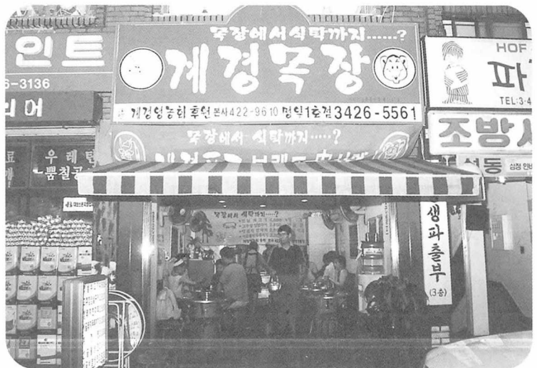
▲계경목자 명일1호점 전경