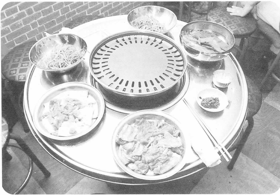
◀생돼지 한마리 (150g 1인분)와 고추장 양념구이를 차려 놓았다. 가격은 1인분에 2,800원

9610)은 강원도 영월의 영농후계자들의 모임인 계경영농회에서 생산되는 돼지고기를 이곳의 회원인 최계경씨가 나름대로 기획하고 구상하여 최근 3개월 전부터 “계경목장”으로 상호를 등록하고, 맥반석을 이용한 생돼지고기 전문체인점 “계경목장”을 모집하는 것으로 이 사업을 시작하였다.