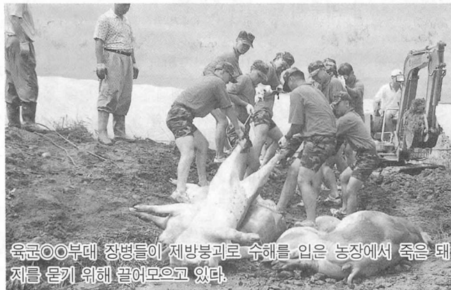
육군00부대 장병들이 제방붕괴로 수해를 입은 농장에서 죽은 돼지를 묻기 위해 끌어모으고 있다.