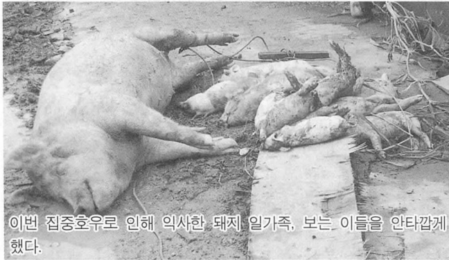
이번 집중호우로 인해 익사한 돼지 일가족, 보는 이들을 안타깝게 했다.