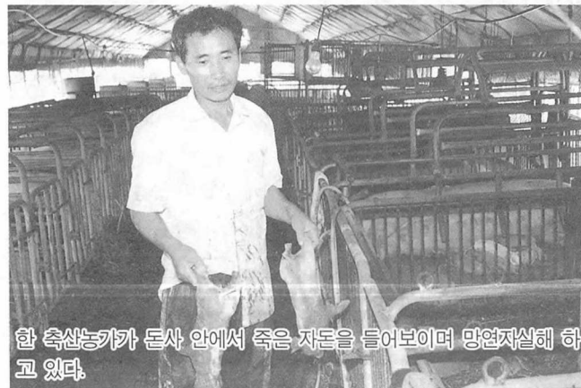
한 축산농가가 돈사 안에서 죽은 자돈을 들어보이며 망연자실해 하고 있다.

위/사람의 힘으로 폐사돈을 처리하기에는 역부족이다. 한 양돈농가가 지역 농협에서 제공받은 굴삭기를 이용해 돼지를 묻고 있다.