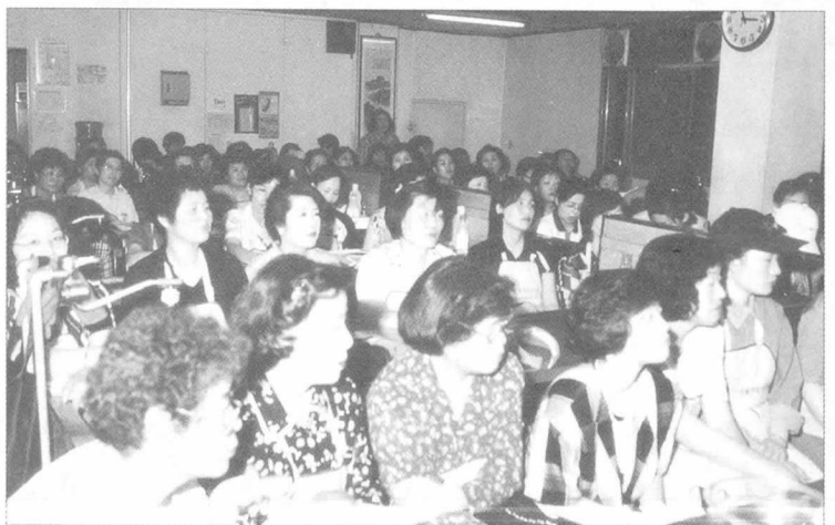
▲이번 3차 돼지고기 요리교실에는 120여명의 강습생들이 참여했다. 이 중에는 남자 강습생들도 많이 참여하여 열기를 더했다.

본회가 주최하고 한국식생활개발연구회(회장 : 왕준련)가 주관한 제3차 돼지고기 요리교실은 지난 5월 25일부터 29일까지 5일동안 하루 3