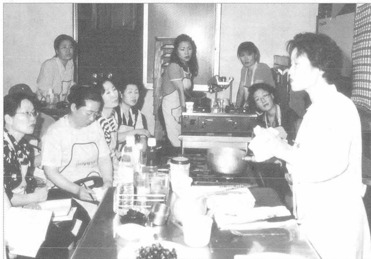
▲요리 강사가 돼지고기 조리실습에 앞서 돼지고기를 더욱 맛있게 요리할 수 있는 비결을 설명하고 있다.

여 전국 돼지고기 직판장, 요식업소, 정육점 등을 통해 소비자에게 배부한 바 있으며, 지난 5월 16에는 관악산 입구에서 최상백 회장 등 본회 전직원이 참가한 가운데 등산객들에게 돼지고기 소비홍보용 요리책자, 전단, 팜플렛을 배부하기도 하였다. 또한 26일에는 수도권 축산대학생들과 함께 축산물 소비촉진 가두 홍보 캠페인을 전개하였으며, 축산물 소비촉진 결의대회 주관, 돼지고기 소비홍보용 애드벌룬 제작·전시, 일선조리사·영양사·음식점 경영자 조리교육 지원, 축산물 소비촉진 어린이 글짓기대회 주최 및 시상, 제3차 돼지고기 요리교실 개최 등 각종 행사를 통해 돼지고기 소비가 촉진될 수 있도록 노력하였다.