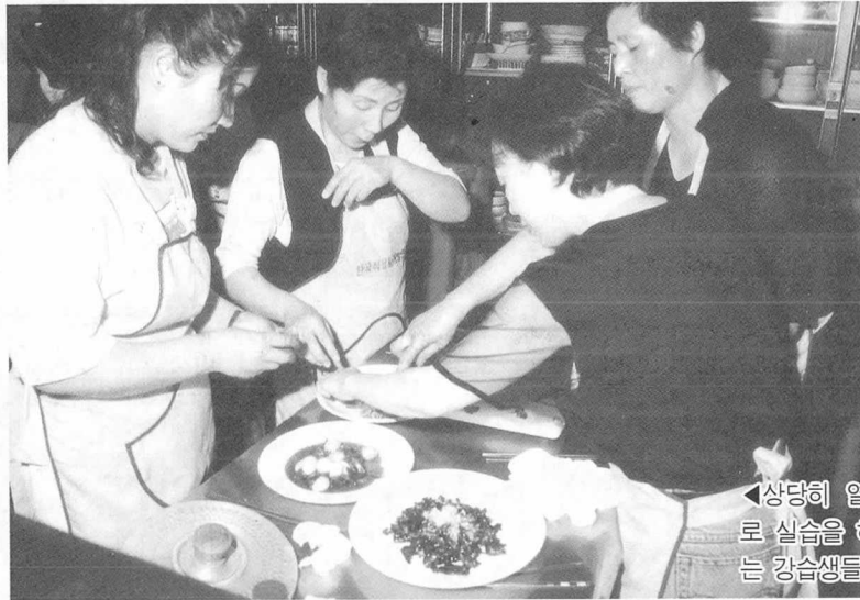
◀상당히 열정적으로 실습을 하고 있는 강습생들.