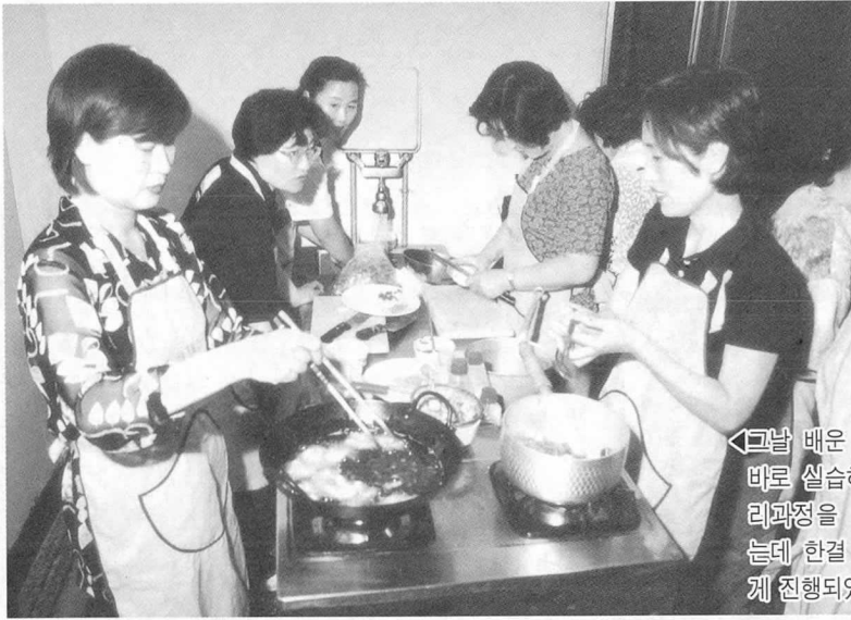
◀그날 배운 요리는 바로 실습하여 조리과정을 습득하는데 한결 수월하게 진행되었다.