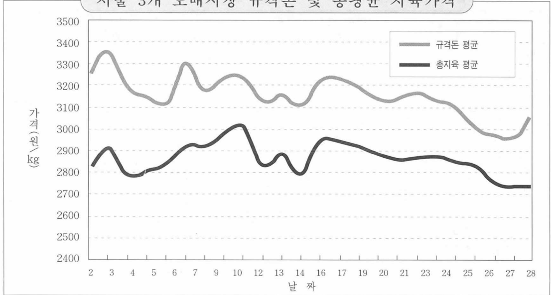
서울 3개 도매시장 규격돈 및 총평균 지육가격