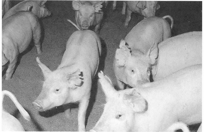
▲과밀이나 너무 수증기 밀도가 낮음은 농장에서 폐렴을 유발하는 주요 인자이며 대책 수립시 이를 교정하여야 한다.

일반적으로 새로운 농장 건축시 건물의 방향은 각 돈사의 환기에 상당한 영향을 미치게 된다. 불행하게도 이와 같은 것은 대단히 복잡하며 정확하게 시설을 설계 할 수 있는 건물의 설계자에게는 해당 지역에 대한 정확한 기후 자료가 필수적이다. 따라서 새로운 건물의 신축을 계획중일 때 특히 지역적인 환기 전문가에게 도움을 청하는 것이 권장된다. 가능하다면 새로운 건물은 질병 대책에 있어서 보조적인 도움을 얻기 위하여 기존 건물로부터 분리된 곳에 새로 건축하여야 한다.