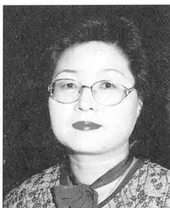
독서대상 시상식을 가졌다.

학생, 교사 부문으로 나누어 시상된 이 시상식에서는 '작은 도서관 운영' '독서여행'