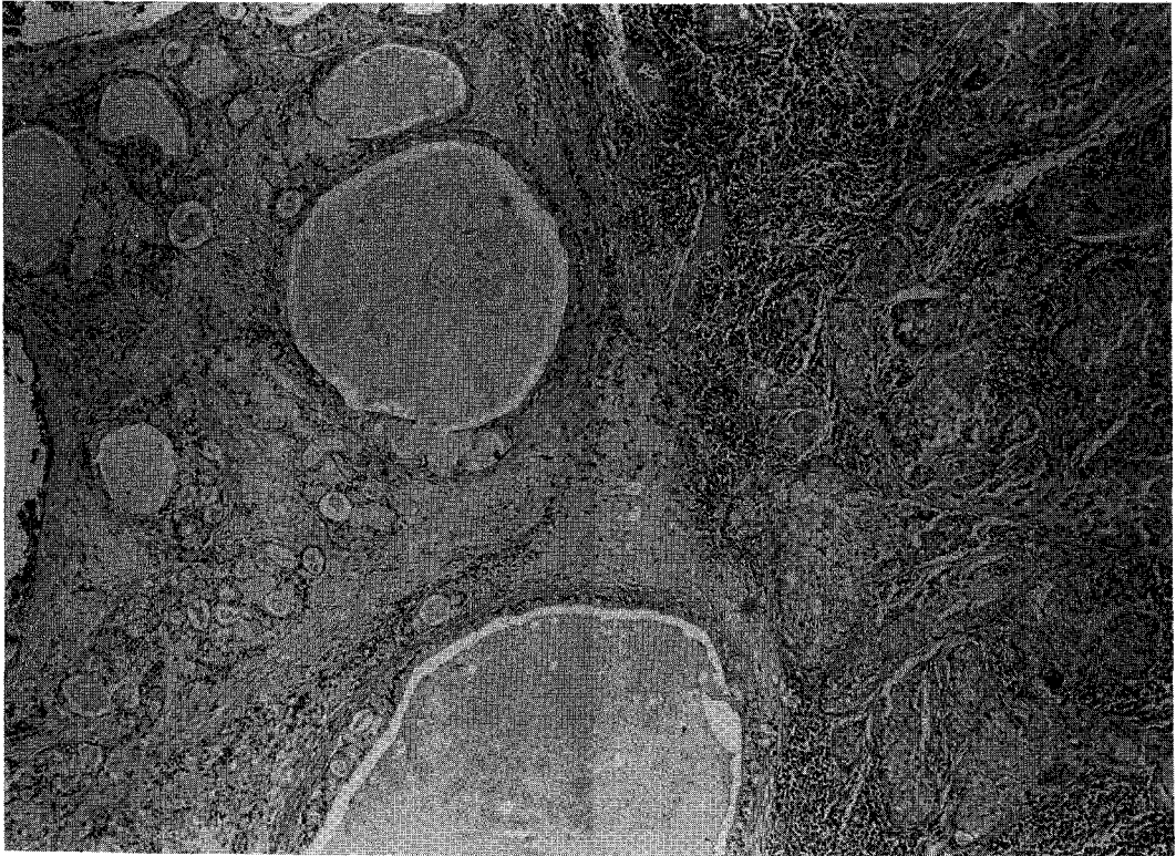
Fig. 2. Low grade mucoepidermoid carcinoma, showing glands, mucus-filled cysts and solid nests of cells(H&E stain 100×).

Klacsman 12) 은 전자현미경을 이용하여 점액선 세포, 사립체와 당원이 충만된 세포, 미분화세포, 이행세포 및 편평상피세포를 확인하고, 이들 세포의 표현정도와 세포내 미세구조물에 의해 저등급과 고등급으로 분류하였으며, 저등급은 비교적 전이가 드문 양성이고 고등급은 악성의 경과를 취한다고 하였다. Yousem 등 10) 과 Heitmiller 등 3) 은 이와같은 조직학적소견에 따른 임상양상을 조사하여 조직학적 등급이 환자의 예후를 결정하는 중요한 요소라고 하였다.