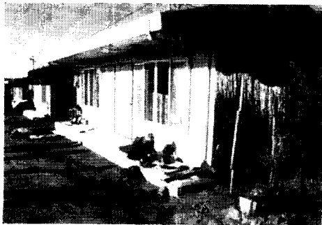
<사진 2> 노인촌락 입주자들은 대부분의 농작물을 가을에 집밖 공터에서 건조시킨 뒤 부피를 축소하여 집안에 꼭 필요한 양만 보관한다.