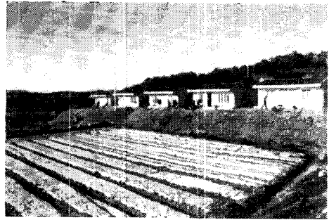
<사진 4> 일직선으로 늘어선 창고와 조립식 건물이 발 가운데 있어 멀리서 보면 수용소식 집단농장을 연상하게 하여 노인촌락에 살고있다는 것이 자랑스럽지 못하게 느껴지고 자식이나 친구가 찾아왔을때 안락한 환경에서 살지 못한다는 인상을 주어 우울한 감정을 유발한다.

요약하자면, 노인촌락의 주거환경은 입주자의 눈에 젊은 사람의 왕래와 쾌적한 자연경관, 문화시설의 전망이 조혜 제공되어 입주자의 정서안정과 사기를 높이는 효과를 발휘해야한다고 하겠다.