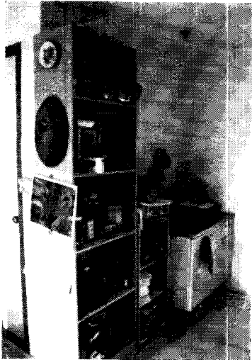
<사진 1> 조립식건물 벽이 견고하지못해 조리대를 세워놓을 수는 있지만 벽에 선반등 고정시킬수는 없기에, 조리대 옆에 책꽂이를 높이 세워놓고 선반대용으로 사용한다