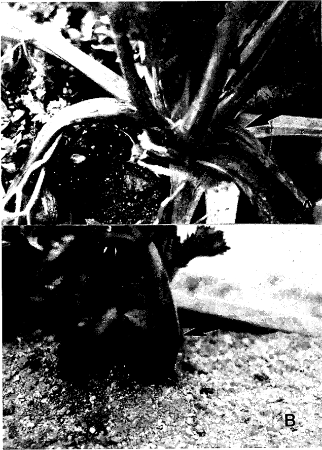
Fig. 1. Bacterial soft rot symptoms produced on stems of celery. A) The soft rot symptoms produced on stems of celery in the field. B) Bacterial soft rot on stems of celery produced by Ce1 of E. carotovora subsp. carotovora seven days after inoculation in the pot. Arrows indicate soft rot symptoms.