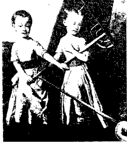
(그림 10) Blunt家 어린이들, 1770. 남자 어린이의 dress는 활동성을 주기 위해 허리에서 단까지 열려 있었다. Elizabeth Ewing, p.50.

위에서 살펴본 바와 같은 변화가 어린이 의복에서 나타난 데는, 당시의 사회적인 배경을 기반으로 하여 이 시기에 많이 읽혀진 J. J. Rousseau의 『에밀』의 영향으로 볼 수 있다. Rousseau의 사상의 영향으로 인해 당대의 여성들은 모든 관습에 대해 의문을 갖도록 조장되었고, 1780년경에는 10대 소녀들이 단순한 의복을 착용하였을 뿐만 아니라, 어머니들도 최소한 아침 시간만이라도 단순한 frock을 입기 시작하였다. 57) 그리고 1780년대에 유행한 여성 dress의 급진적인 변화는 가는 허리에 중점을 두지 않았고, 어린이들의 흰색 dress가 1780년대의 여성들에게 받아들여졌다는 것과 겸손하고 무늬있는 면직물과 리넨이 격식을 차리지 않는 의복용으로 점차 많이 받아들여지고 있었다는 것이다. 58)