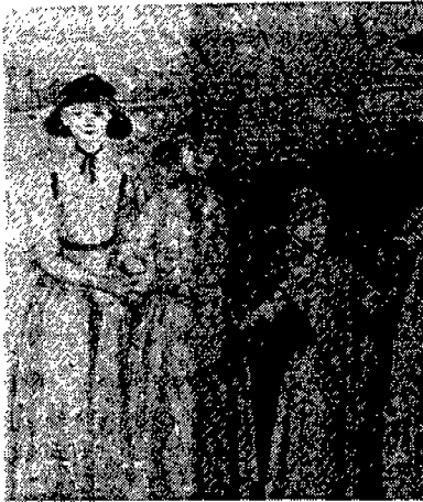
(그림 9) 여자 어린이들은 1760년대부터 단순해진 새로운 스타일의 드레스를 착용하기 시작하였다. 1760년경. Elizabeth Ewing, p.45.