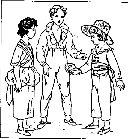
(그림 6) 어린이 의복, 1770~1775. Iris Brooke, English Children's Costume Since 1775, p.9.

1750~1760년대의 상류계층의 남자 어린이들은 4~5세가 되기 이전에는 dress를 입었고(그림 4) 그 이후부터는 성인 의복의 축소형을 입었다. 즉, 부유층의 소년들은 몸에 잘 맞는 실크 코트, waistcoat 그리고 레이스로 장식된 질이 좋은 리넨 셔츠, breeches를 착용하고 실크 스타킹과 굽이 높은 신발을 신는 외에 분바른 가발을 쓰고 축