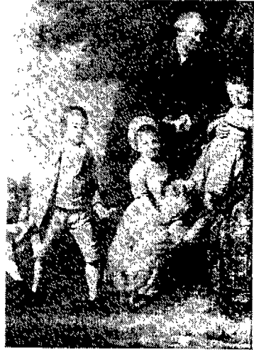
(그림 5) Francis Wheatley家, 1774년. Clare Rose, p.46.