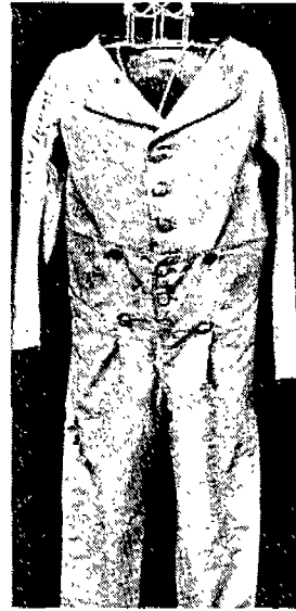
(그림 11) Skeleton suit 실물, 19세기 초. Elizabeth Ewing, p.48.

skeleton suit는 허리보다 높게 올라온 바지에 다른 색상의 장식띠를 함으로써 당시 여자 어린이 의복의 실루엣에 가까운 완전히 새로운 실루엣을 나타내었다. 당시 여자 어린이들은 허리선이 높은 dress에 다른 색상의 띠를 허리에 두르고 프릴 달린 neckerchief를 착용하고 있었다.