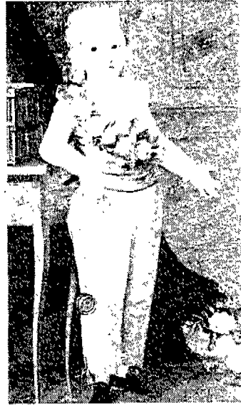
(그림 8) 프랑스 Louis 17세의 어린적 모습으로 skeleton suit를 착용하고 있다. 1790년경. François Boucher, p.304.

활동하기에 편한 trousers는 성인 남자들이 착용하기 한 세대 이전에 이미 남자 어린이들이 작