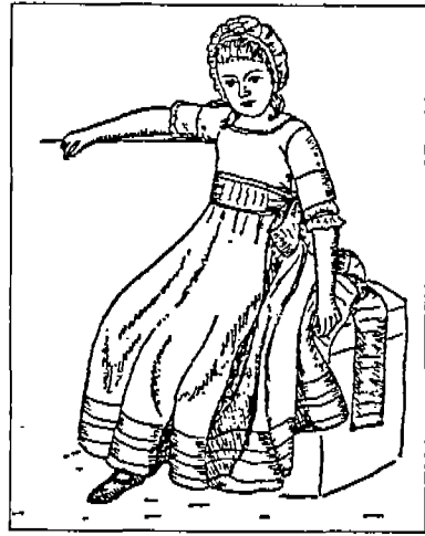
(그림 12) 목선이 낮은 frock은 흰색의 머슬린으로 되어 있으며, 허리선보다 높게 sash를 두르고 있다. 1768~1769. Phillis Cunnington & Ann Buck, Children's Costume in England, 1300~1900, p.142.

dress에 있어서 두가지 중요한 아동기의 표시로 는 bodice의 뒤여밈과 leading strings이다. 70) 그 림 13에서는 dress에 나타난 뒤여밈과 leading strings을 볼 수 있다. 뒤여밈이 어린이에게 왜 적 합한지는 알려지지 않았으나 단정한 모습을 유지 하기 위한 것으로 보인다. leading strings는 걸음 마를 시작하는 아기에게는 분명히 도움이 되는 것