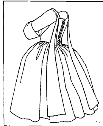
(그림 13) 브로케이드 된 흰색의 실크 드레스, 18세기 중 기. Phillis Cunnington & Ann Buck, p.129.

이며, 여자 어린이 의복의 leading strings는 부모 들의 지도에 의존한다는 상징을 나타낸다.