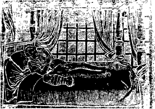
(그림 3) 어머니와 Swaddling된 아기, 1605. Elizabeth Ewing, History of Children's Costume, p.17.

들이 있는 것 42) 으로 보아 스웨들링이 상당히 보편화되어 있었음을 알 수 있다.