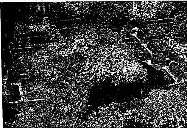
〈사진 2〉 영국 Sissinghurst castle garden내의 화이트가든.

Sissinghurst Castle Garden은 쾌적한 분위기 조성을 위하여 전술한 것처럼 시간제한 입장을 하고 있으며 입장정원제를 운용하고 있다. 이용객이 정원(定員)을 넘어설 경우