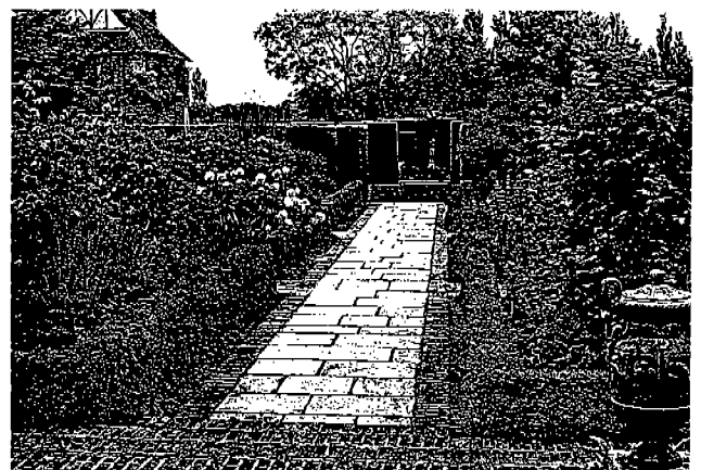
〈사진 1〉 영국 Sissinghurst castle garden의 전경.

Sissinghurst Castle Garden은 영국의 전통적 자연풍경인 구릉과 전원을 배경으로 하고 있으며 가든의 일부는 HaHa수법 13) 을 도입하고 있다. 이곳은 처음에 영주관저로서 중세에 세워졌는데, 15세기 경 Backer가족에 의해 큰 저택으로 증축되어 이용되었다. 그러나 1756~1763년에 영국과 프랑스의 전쟁시에는 프랑스 포로들의 감옥으로 사용되었고 전쟁의 막바지 무렵에 저택의 대부분이 허물어져 방치되었다. 그 후 1930년 Vita Sackville-west와 Harold Nicolson부부(夫婦)가 허물어진 저택과 정원을 사들여, 허브를 이용하여 새롭게 정원을 조성하였으며 1938년 조성된 정원을 유료화하여 대중에게 처음으로 공개하였는데, 당시 방문한 관객은 약 800명 정도였으며 입장료는 5펜스였다. 그 후 Vita부부(夫婦)는 1967년 환경기금단체인 National Trust에 이곳을 기부하면서 점차 세계적인 허브가든의 면모를 갖추기 시작하였다 14) .