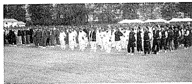
체육대회 개회식 광경

등 종목별 대항전을 펼치며 회원간 친목과 유대를 다졌다. 이날 체육대회에서는 안양·시흥건축사회가 종합우승을 차지하였으며 수원·오산지역건축사회와 고양지역건축사회가 각각 준우승과 3위를 차지했다.