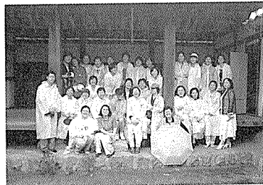
전통건축답사에 나선 여성건축사 회원들