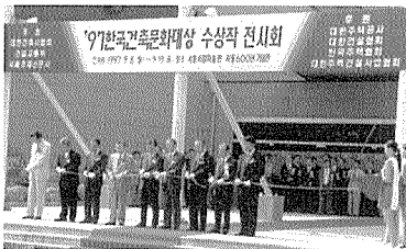
전시회 테이프컷팅 광경

한편 올해의 각 부문 수상작들은 지난 9월 8일부터 9월 19일까지 같은 장소에서 전시돼 일반에게 공개됐다.