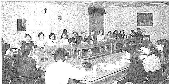
일본 간호학생들의 임상실습 평가회