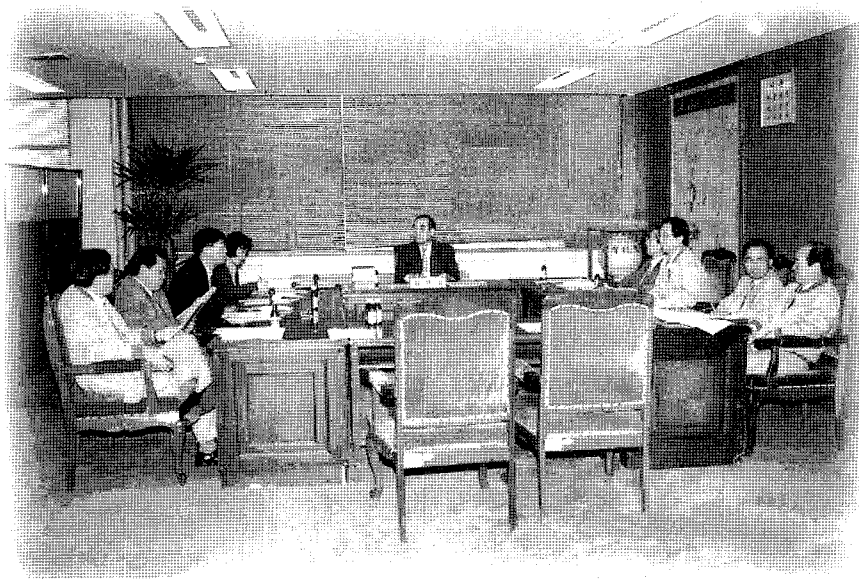
제1차 편집 및 학술분과위원회 회의 모습