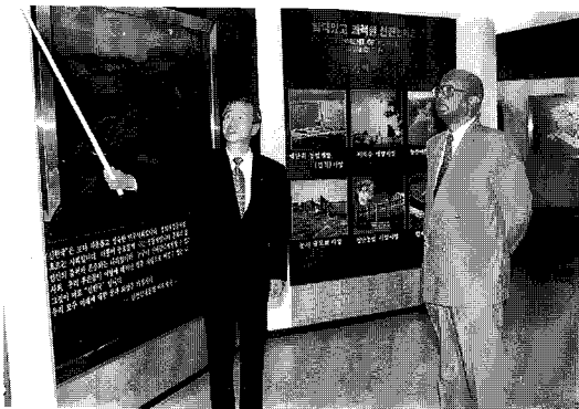
농진공 홍보관 관람