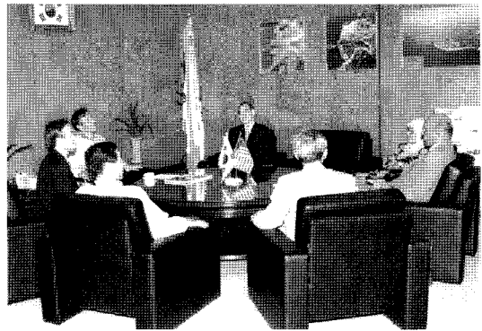
업무 협의중인 KCID-ICID 대표