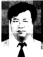
이 중 오(KIMM 원자력공인검사사업단)

'83 경북대학교 사범대학(학사) '87 한국과학기술원 물리학과 (석사) '90 한국과학기술원 물리학과 (박사) '91 - 현재 한국기계연구원 선임연구원