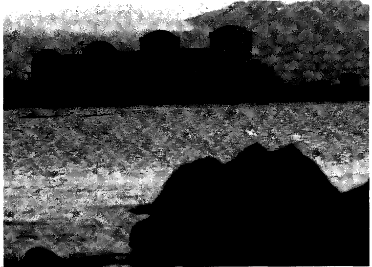
고리 원자력발전소. 환경적인 측면에서 본다면 기후변화협약은 화석 연료의 사용 감축과 에너지 효율의 증가, 청정 기술 개발 등을 통해 국내 대기 환경의 개선에 크게 도움을 줄 것으로 기대된다.

소위 재생 가능한 에너지원인 태양에너지, 수력, 풍력, 조력, 지력 발전 등과 함께 원자력 발전이 하나의 대