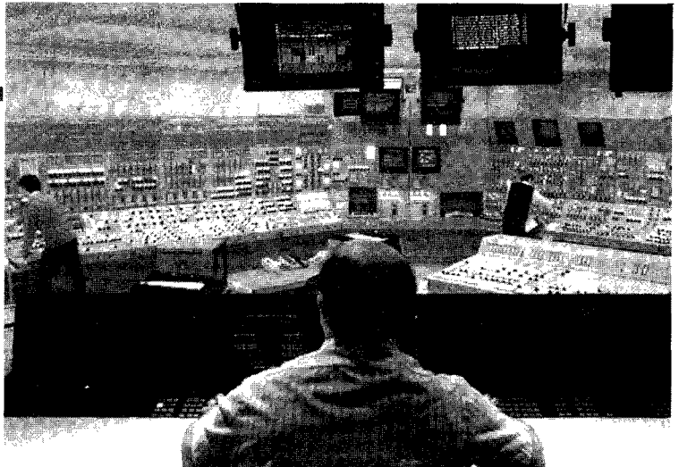
Pickering 원전의 훈련 시뮬레이터 내부. 온타리오 하이드로사의 복구 계획에 따르면 총 7기의 가동 중단된 원전의 우수 인력을 나머지 12기의 원전에 재배치하여 체직된 운영 업무를 해결하고 훈련 개선을 보존하도록 하고 있다.

CANDU 원전 기술은 40여년간에 걸쳐 개발·개량되어, 안전하고 경제적인 전력 생산으로 이 분야에서 세