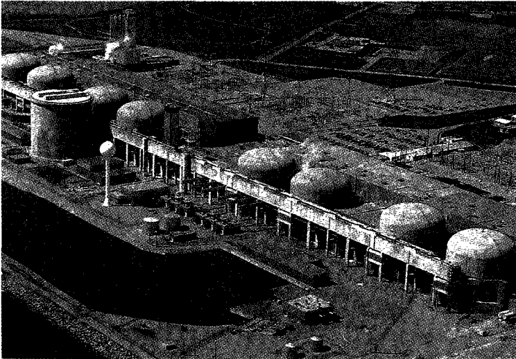
온타리오 하이드로사의 Pickering 원전. 온타리오 하이드로사는 북미 최대의 전력 회사 중의 하나로 3천만 kW의 총설비 용량을 갖추고 있다.