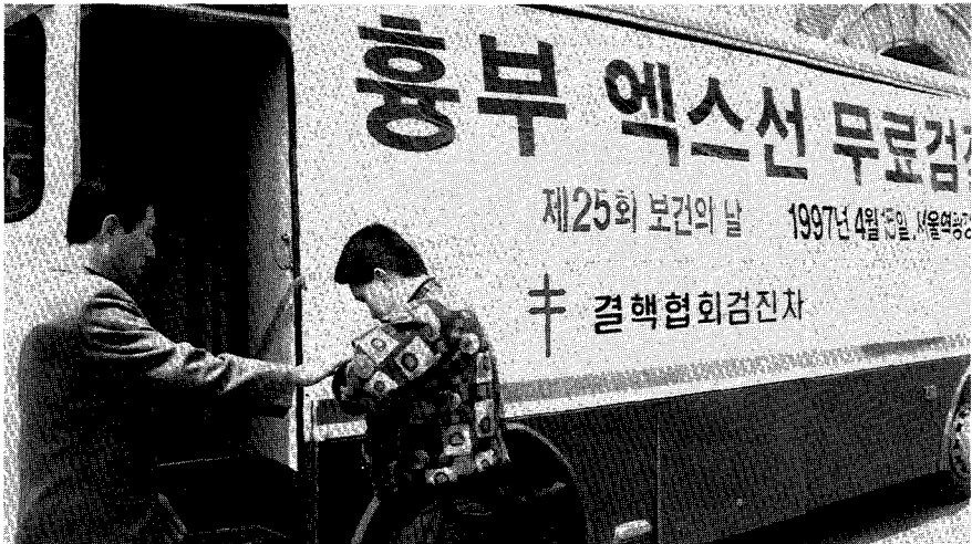
▲결핵환자 발견사업의 일환인 엑스선 검진 광경이다. 사진은 제25회 세계 보건의 날 캠페인 때 서울역 광장에서 실시된 무료검진 모습이다.

중률, 엑스선상 균양성유병률, 결핵치료력 및 약제감수성검사 결과 등에 대해 과거 6차에 걸친 조사자료와 함께 각종 분석을 통해 역학적 추세를 파악하기 위한 사업이다.