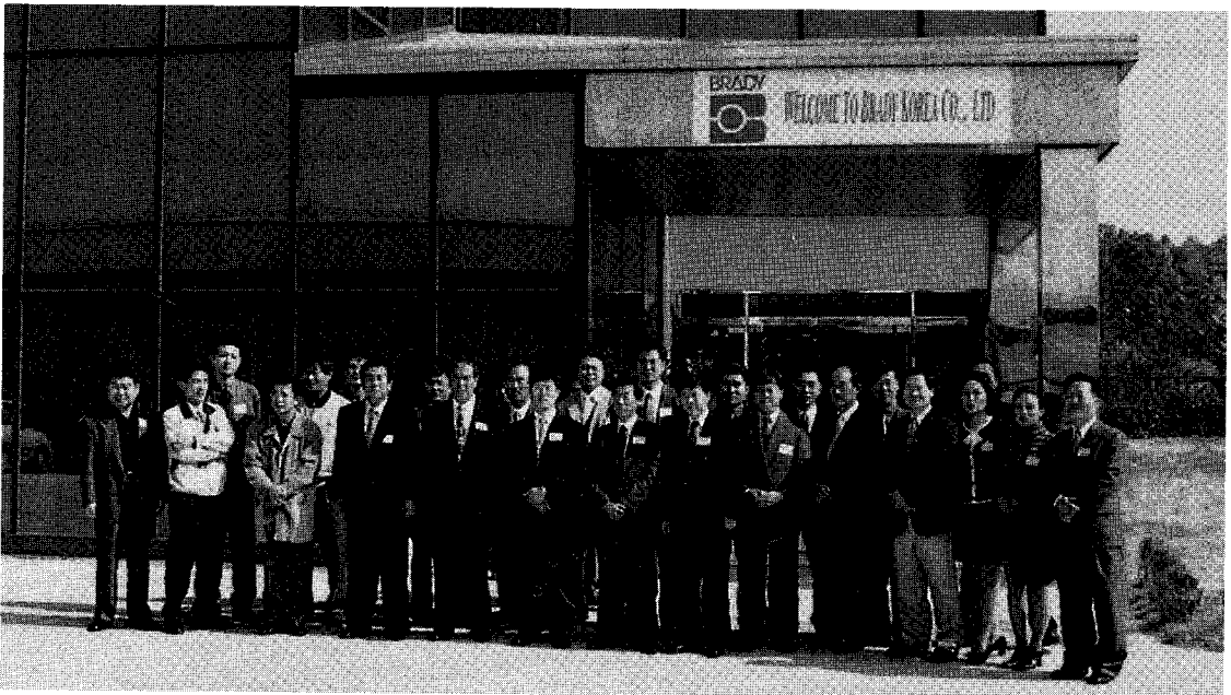
▲ 한국브래디(주) 옥천오픈하우스 행사참가자들이 공장앞에서 포즈를 취했다.