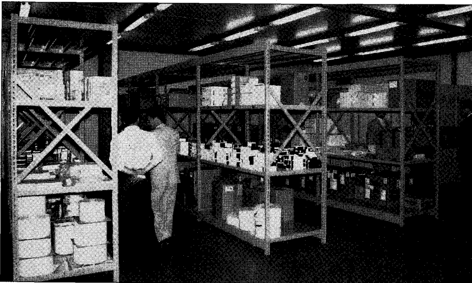
◀ 한국브래디(주) 의 잘 정돈된 창고내부 전경.

이러한 4C 정신을 바탕으로 지난 96년에는 브래디가 6억, MARKEM이 14억원 정도의 매 출액을 올린 바 있으며 올해는 브래디가 18억정 도 MARKEM이 20억 정도의 매출액을 올릴 것으로 예상하고 있어 매년 매출액그래프가 꾸