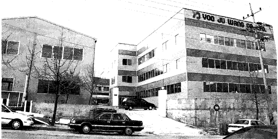
▶ 새로 건축된 깨끗한 모습의 안산 유주왕 전경.

기존 PVC라벨 제조메이커로서 새로운 소재인 OPS필름을 개발하게 된 유주왕의 박건규사장은 "10억원가량의 개발비를 투입하고 70억 원을 투자하여 OPS생산설비를 갖춘 것은 미래 수요에 대한 확신때문이었습니다. 더욱이 지난