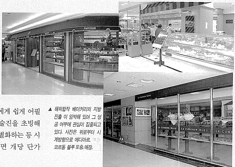
▲ 해외합작 베이커리의 지방 진출이 임박해 있어 고성공 여부에 관심이 집중되고 있다. 사진은 위로부터 시계방향으로 에디아르, 코르동 블루 포송 매장.