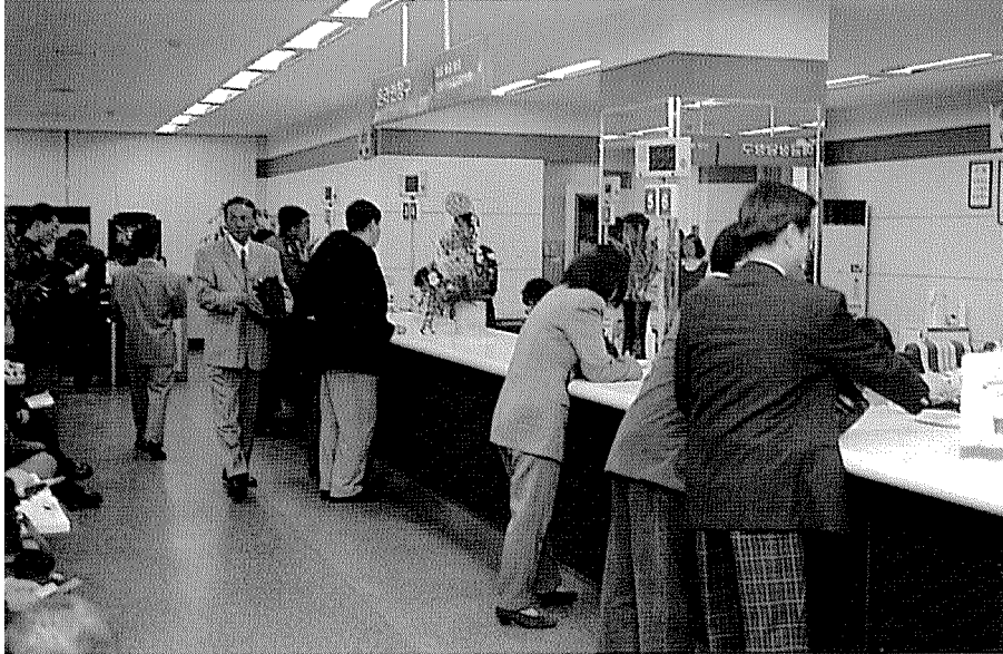
▲ 할부 금융은 부동산 담보나 점포 보증금, 개인 신용 등으로 필요한 자금을 쉽게 조달할 수 있다.

제과점에서 기계·인테리어 시설시 목돈이 필요하게 된다. 이때 필요 자금을 손쉽게 조달할 수 있는 방법이 할부 금융 이용 방법이다. 이에 할부 금융 이용 절차와 지원 가능 금액 산출, 이용시 얼마 정도의 금액을 부담하면 되는지 살펴본다.