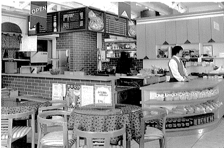
▲ 제과점 인테리어. 기계 설비 비용으로 천만원을 1년간 사용할 때 월 91만원 정도를 납부하면 된다.