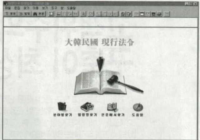
〈그림 1〉 대한민국 현행법령 초기화면

본문에 한법이라도 쓰이고 있는 특정단어를 전체 법령에서 찾을 때 사용하는 방법이다. 이 때 접속어를 이용할 수도 있고, 검색창에 입력한 단어의 검색범위를 '법령집 전체에서, 최근 찾은 결과에서, 분야를 지정하여' 중에서