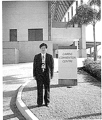
▲ 호주 퀸즈랜드 케언즈컨벤션센터에서 열린 제10차 아시아수의학대회에 참석한 필자

수술실습실에는 10대의 수술대가 놓여 있어서 학생들이 조별로 동시에 수술실습이 가능하게 되어 있는 것을 볼 수 있었으며, 수술실 및 수술준비실의 출입문은 유연하고도 투