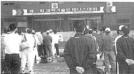
▲ 제17회 과학기술인테니스대회 개최식 광경

한국과학기술단체총연합회(회장崔亨燮)는 10월 17일 잠실 올림픽 테니스코트에서 제17회 과학기술인 테니스대회를 개최했다.